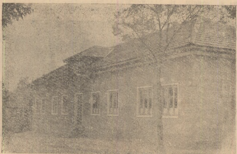
IN CLIȘEU: Școala nouă de 4 ani din satul Oarda de Sus.

Avînd școală fără clase trebuie să fiți atenți, pentru că nu numai... pruncii pot rămîne repetenți.