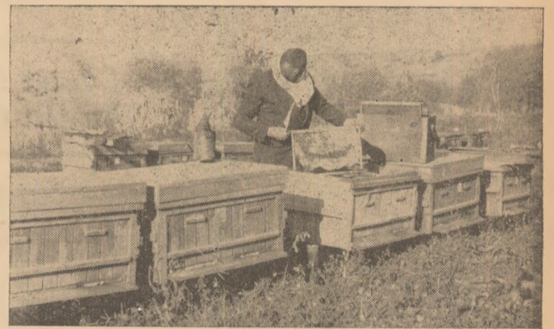
ÎN CLIȘEU: Pregătirea stupilor pentru iernat la gospodăria colectivă „Partizanul roșu” din Benic.