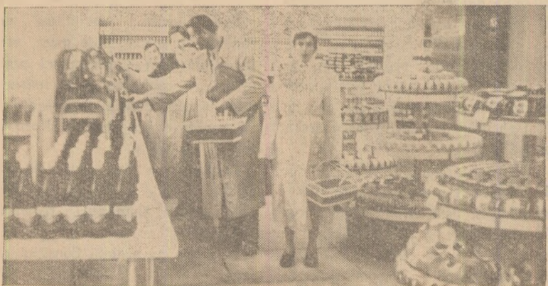
Interior din noul magazin cu autoservire din Alba Iulia.