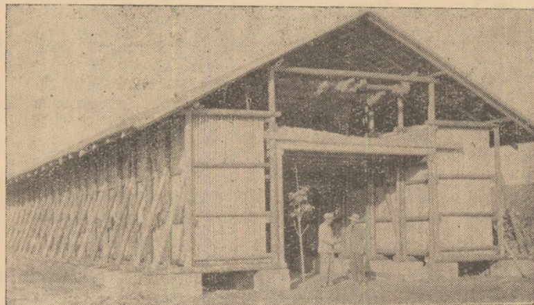
Noul pătul cu pod și magazie de la gospodăria agricolă colectivă din Teiuș.

După terminarea simpozionului a rulat filmul „Proaste obiceiuri alimentare”. Coresp. V. CISTEANU