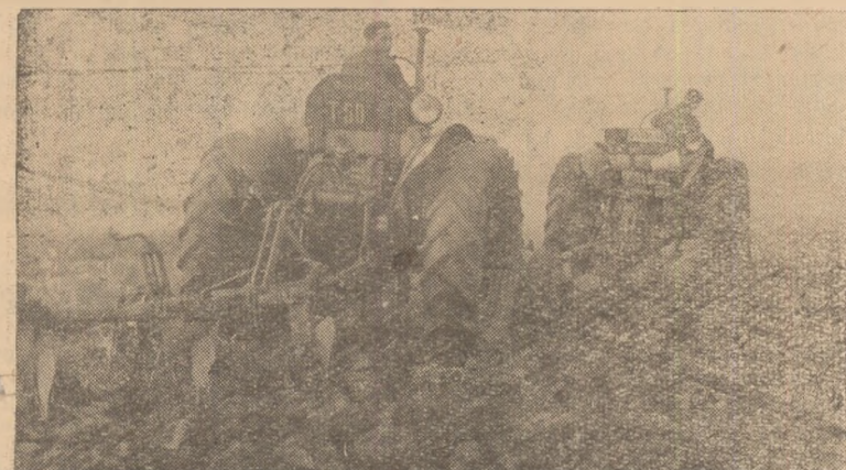
Pe ogoarele gospodăriei agricole colective din Bărbantș se muncește de zor la executarea arăturilor adânci de toamnă.

Zilele trecute, la Comitetul rațional de partid a avut loc o consfătuire cu tema „Pentru un conținut mai bogat al gazetelor de perete”.