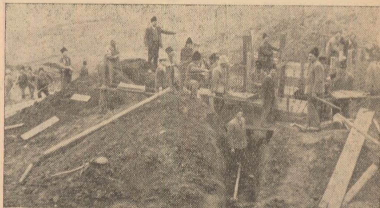
La gospodăria colectivă din Almașul Mare, apa din trei izvoare este captată într-un bazin colector, de unde prin țevi este dusă la grajduri.

Comitetele comunale de partid, organizațiile de bază, sfaturile populare au sarcina de a acorda mai multă atenție îmbunătățirii activității cultural-educative. În acest scop trebuie mobilizați toți activiștii culturali, spre a prelua inițiativa activiștilor culturali din Stremț și a asigura activitate cultural-educativă bogată și variată.