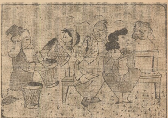
Moș Gerilă — om subțire — Mîncătorilor de sîmburi, ca gunoi să nu mai facă, le oferă în dar... coșuri.