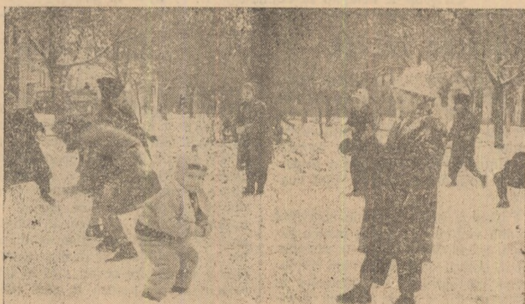
Prima zăpadă — bucuria celor mici.

Tot în cadrul acestei ședințe, în baza dezbaterilor ce au avut loc, s-au adoptat o serie de măsuri importante menite să contribuie și mai mult la organizarea și desfășurarea întrecerii socialiste în 1962 în cele mai bune condiții.