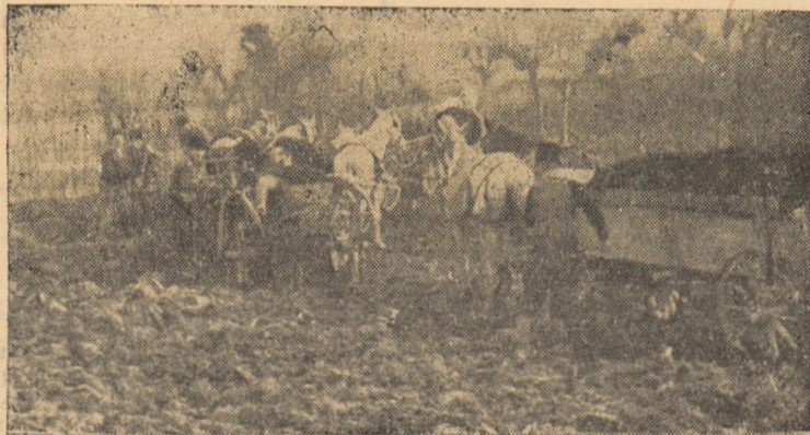
Transportul gunoului în câmp la G. A. C. Micești.