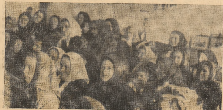
ÎN CLIȘEU: Aspect de la adunarea generală a femeilor din Gospodăria agricolă colectivă Cistei.