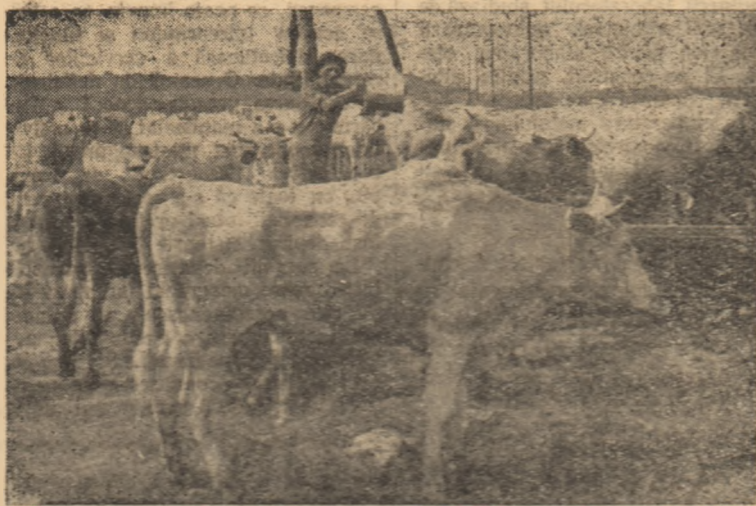
Aspect de la ferma de vaci a G.A.C. Teiuș.

Prin aplicarea unei agrotehnici corespunzătoare, colectivștii din Micești, care în anul trecut au cultivat cu legume o suprafață de 65 hectare, au realizat de la grădina un venit de peste un milion de lei. Reșiile timpurii, de pildă, cultivate pe o suprafață de 6 ha, au adus gospodăriei un venit total de 195.750 lei, ceea ce revine 32.625 lei de fiecare hectar. Cartofii ierovizați cultivați pe o suprafață de 5 ha, la care s-a obținut o producție de 26.000 kg la hectar, au adus gospodăriei din Micești un venit de 205.100 lei, re-