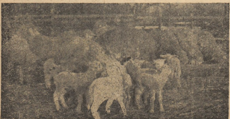
Primii miei — G.A.C. „Unirea” Alba Iulia

Agronoame, agronoame îți cam lași agricultorii! Nu uita că vine tema: „Cum tratăm... dăunătorii”.