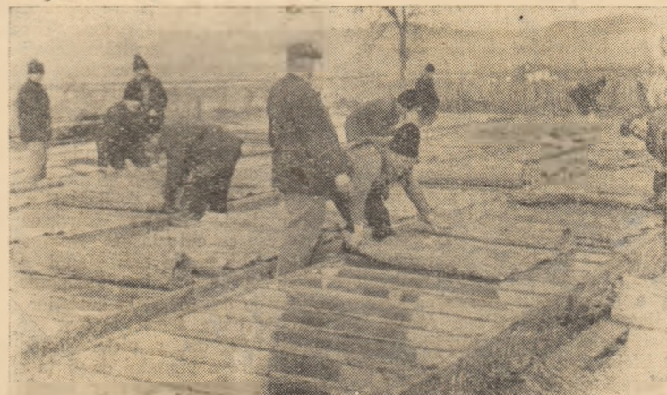
Pregătirea răsadnițelor la G.A.C. „8 Martie” Micești

avînd în vedere ca ei să fie de pe aceleași ulițe, iar forțele să fie echilibrate. Fiecare brigadă și-a luat în primire inventarul de muncă, suprafețele de teren și culturile de care răspunde pentru lucrările agricole. Totodată, s-a stabilit și felul cum trebuie să se lucreze, precizîndu-se de pe acum suprafața din fiecare cultură la care trebuie să se facă lucrările. Astfel, fiecare echipă va trebui să execute plantatul răsadu-