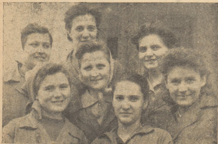
ÎN CLIȘEU: Un grup de muncitoare frunțașe de la fabrica „Ardeleana”, Alba Iulia

Întîmpinînd ziua de 8 Martie, femeile de la fabrica „Ardeleana” muncesc cu entuziasm. Ne-o spun faptele. La secția croi planul pînă la 12 februarie a fost îndeplinit în proporție de 102,60 la sută, iar numai de către femei au fost economisiți 5.272 dm. p. piele. Și-apoi cu o depășire a planului de 6 la sută întîmpină însemnata zi și femeile de la pregătit-cusut, stanță și tras-terminat. Are, deci, dreptate ingineră spunînd că femeile de la „Ardeleana” sînt harnice ca albinele. S. P.