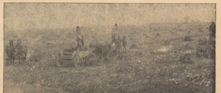
Colectiviști din brigada 7-a, G.A.C. Mihail, la transportul gunoiului.