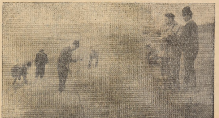
Colectiviștii din Sintimbru vor planta în acest an pomi pe o suprafață de 20 ha. În clișeu: Pichetaul terenului la G.A.C. Sintimbru.