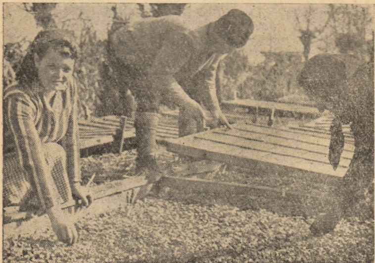
Plivitul răsadului la G.A.C. „Unirea” din Alba Iulia

nu s-a făcut spre sud, cum trebuie, ci tocmai invers, spre nord, ceea ce influențează negativ asupra producției de răsad. De asemenea, nu s-a luat nici o măsură pentru împrejmuirea răsadnițelor împotriva curentilor, iar pe cele 10 ha ce urmează să se cultive cu legume nu s-a transportat încă nici un car de gunoi, deși gospodăria dispune de cantități importante de îngrășăminte naturale.