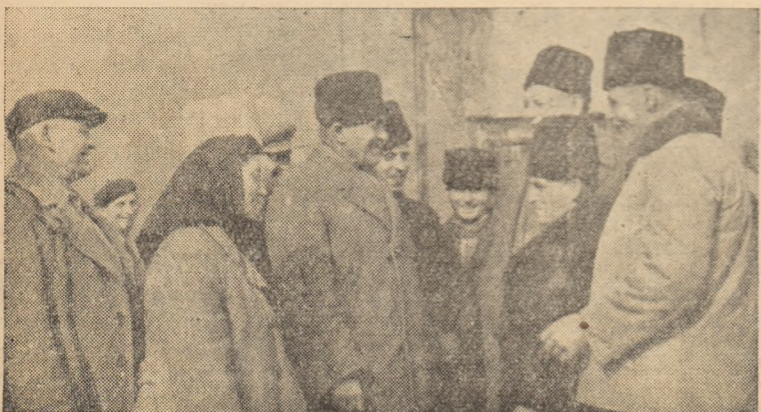
Colectivștii din Beldiu și Teiuș și-au unit forțele într-o gospodărie mare și înfloritoare. În clișeu: Consiliul de conducere, nou ales, discută cu însufletire despre perspectivele de viitor.

...între 12-14 martie, la cinematograful „23 August” va rula filmul maghiar „Hoinarii”, iar la cinematograful „Victoria” filmul englez „Nu te lăsa niciodată”.