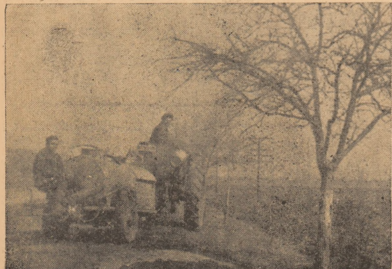
Folosind timpul prielnic din zilele trecute, brigada fito-sanitară de la S.M.T. a stropit împotriva dăunătorilor peste 50.000 de pomi,

...la cinematograful „Victoria” rulează, începînd din 19 martie a.c., filmul gruzin „Dovestea despre o fată”.