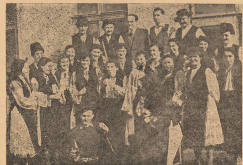
IN CLIȘEU: Membrii brigăzii artistice de agitație din Teiuș.