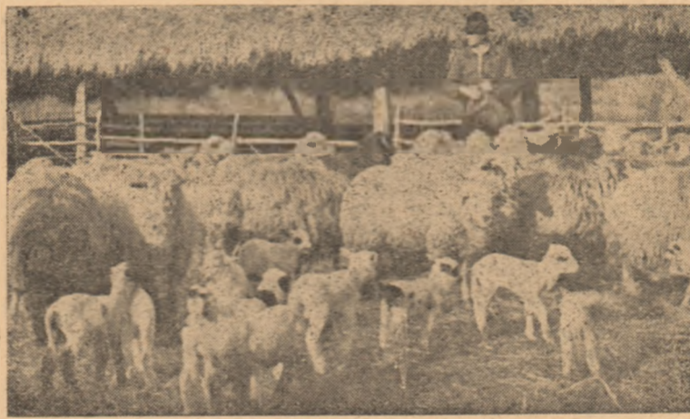
Oile aduc venituri importante colectivităților din Stremț. IN CLIȘEU: Primi miei din acest an la G.A.C. Stremț.