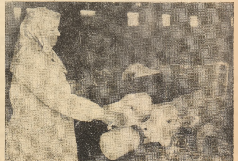
ÎN CLIȘEU: Alăptarea vițelilor cu biberonul la G.A.C. Mihalț.

Bune rezultate se obțin îngrășînd pășunile prin țirire. În acest scop se fac ocoale temporare, cu porți împletite sau de scînduri, în care se țin oile 2-3 nopți. Prin aplicarea acestui sistem de îngrășare, masa verde de pe pășune se poate ușor dubla. Rezultate bune în ce privește sporirea producției pe pășuni se obțin prin aplicarea de îngrășăminte minerale. Experiența și știința au dovedit că un kilogram de îngră-