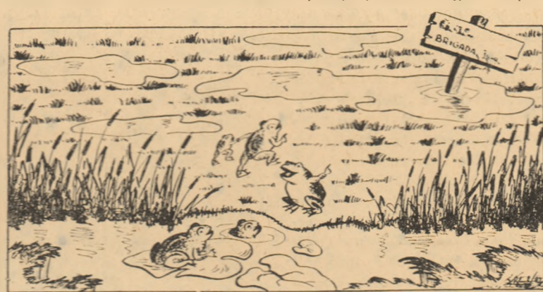
Ce grijulii și ce condiții bune ne asigură șefii brigăzilor a V-a și a VII-a din G.A.C. Mihalț! Să mergem într-acolo că nimeni nune deranjează.

Organizația de partid și sfatul popular din comună au datorită să îndrume și să sprijine mai îndeaproape această gospodărie să mobilizeze toate forțele la executarea muncilor agricole, pentru ca în cel mai scurt timp să termine arăturile și însămînțările atît cele din epoca I-a, cît și cele din epoca II-a.