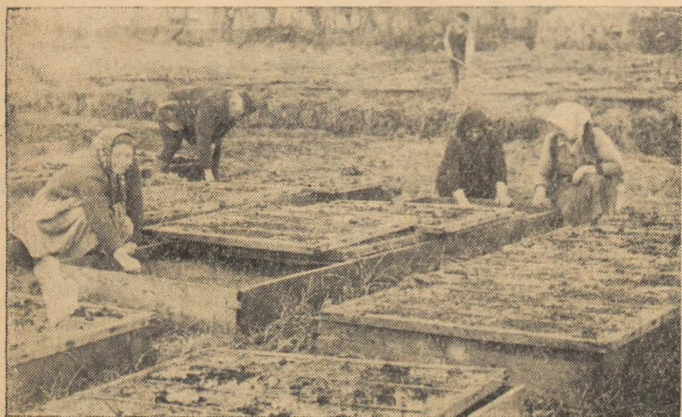
Colectiviștii din Oieșdea care cultivă în acest an 30 ha cu tutun din soiul „Virginia”, vor realiza din această cultură un venit de peste 300.000 lei. În clișeu: Pivitul răsadului de tutun.