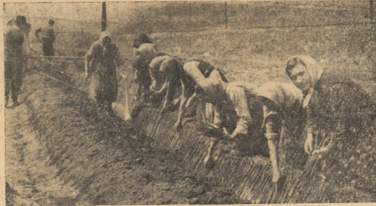
ÎN CLIȘEU: Plantatul viței de vie în pepinieră la G.A.C. Cistei.

la sesiunea extraordinară a Marii Adunări Naționale — 27 aprilie —