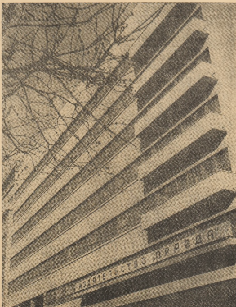
ÎN CLIȘEU: Clădirea combinatului „Pravda” din Moscova.