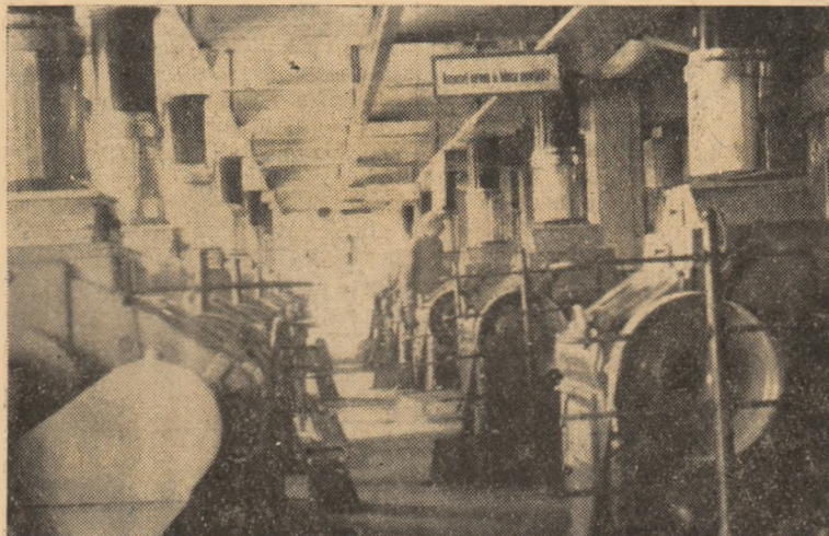
Utilaj modern la moara „N. Bălcescu”

Ținînd cont de importanța deosebită și de aportul agitației vizuale în mobilizarea maselor la îndeplinirea sarcinilor de producție, la obținerea unor produse de calitate superioară, biroul organizației de bază de la moara „N. Bălcescu” va trebui să-și îmbunătățească munca privind această problemă, să organizeze o agitație vizuală cit mai concretă, la fiecare loc de muncă, care să oglindească în obiective și cifre sarcinile colectivului de muncitori, realizările cele mai semnificative, să combată lipsurile ca, într-adevăr, agitația vizuală să contribuie și mai mult la munca politică ce se desfășoară pentru îndeplinirea sarcinilor economice.