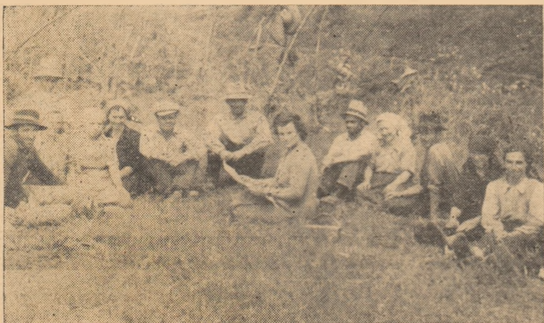
În mijlocul brigăzii a III-a