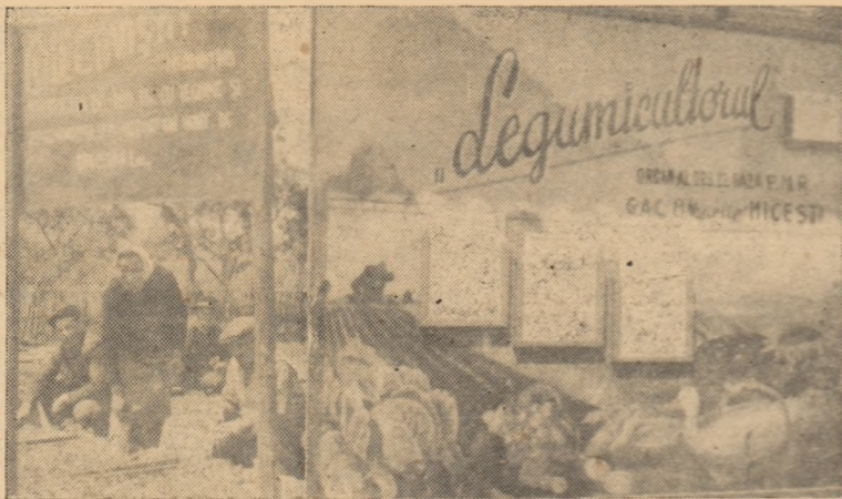
La G.A.C. Micești se acordă o deosebită atenție agitației vizuale și scrise.