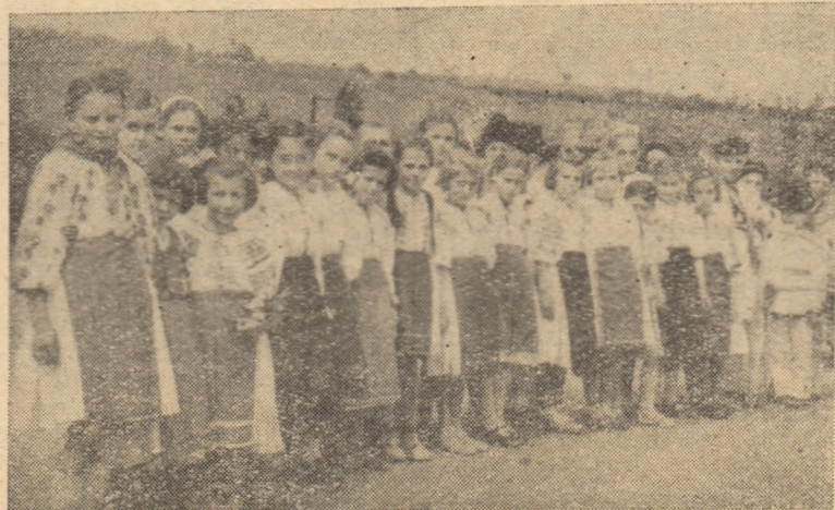
Sfîrșit de an școlar în comuna Cricău. În clișeu: Imbrăcați în frumosul port cricăuan, elevii sînt gata să urce treptele scenei.