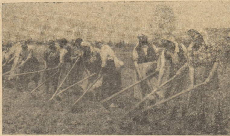
La gospodăria colectivă din Șard colectiviste se dovedesc a fi neîntrecute la prașila porumbului.

Nu știm ce justificări pot aduce conducerile gospodăriilor colective din Oarda de Jos, Căpuș și Pețelca, unde prima prașilă la porumb s-a făcut doar între 25-30 la sută. Poate colectiviștii din aceste locuri nu și dau seama că întîrzierea lucrărilor înseamnă pierdere însemnată de recoltă. De aceea, se impune ca organizațiile de bază din gospodăriile colective rămase în urmă să analizeze stadiul lucrărilor și să ia măsuri hotărîte, pentru ca lucrările de întreținere să se desfășoare într-un ritm mult mai susținut decît pînă în prezent.