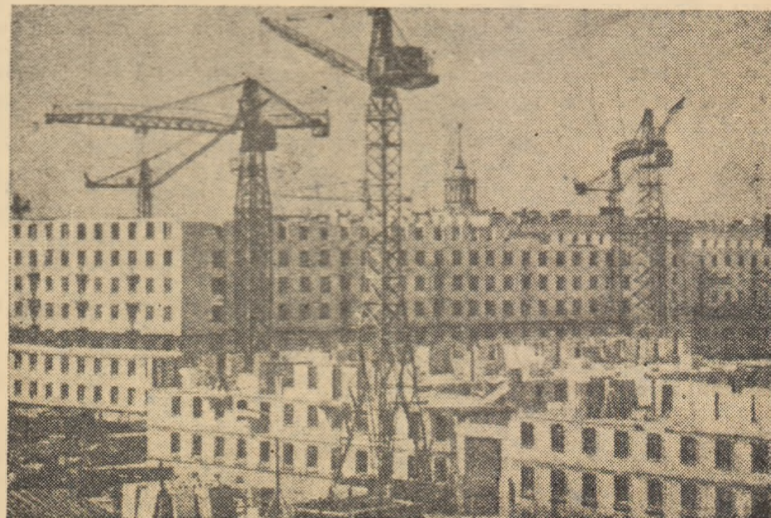
Pentru oamenii sovietici se construiesc locuințe tot mai multe. Suprafața locativă construită anual în U.R.S.S. este echivalentă cu cea a 40 de orașe cu cite 200.000 locuitori.

Construcția de mașini în Uzbekistan continuă să se dezvolte. Se presupune că pînă în anul 1965 volumul producției de mașini va crește mai bine de două ori.