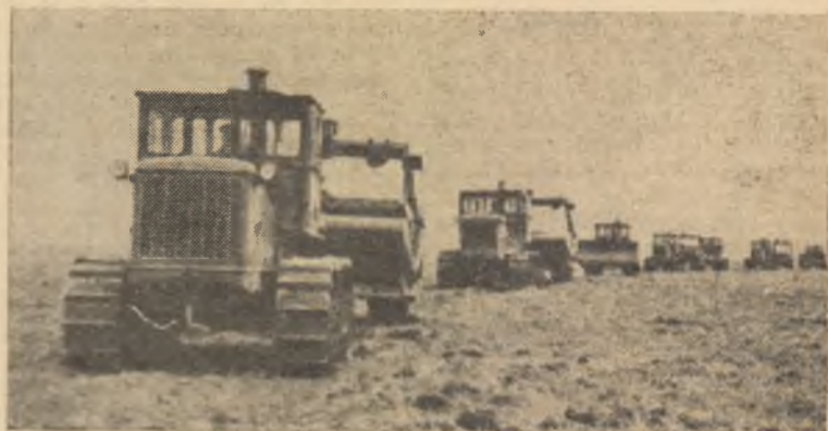
Spre întinsul de nesfârșit al ogoarelor Țării sovietelor pornesc noi tractoare și mașini agricole. În clișeu: O coloană de mașini noi se îndreaptă spre un sovhoz din regiunea Kazahstanul de sud.

Depășirea planului de producție pe anul 1962 numai cu unu la sută va însemna o producție suplimentară de 1.703 mașini-unelte așchietoare de metal, 770.000 tone de oțel, 2.972 de tractoare, 65.500.000 metri de țesături de bumbac și multe alte produse.