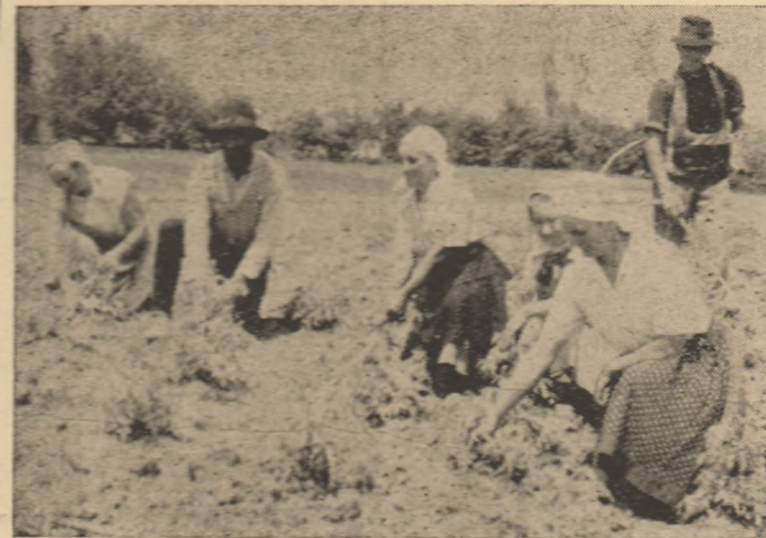
IN CLIȘEU: Copilul roșiilor la G.A.C. Șard.

Mobilizați de succesele obținute, tinerii din raionul nostru pașesc hotărâți spre înfăptuiri și mai mărețe. Fierți pentru aceasta le-o da partidul, viața lor nouă și anii lor tineri.