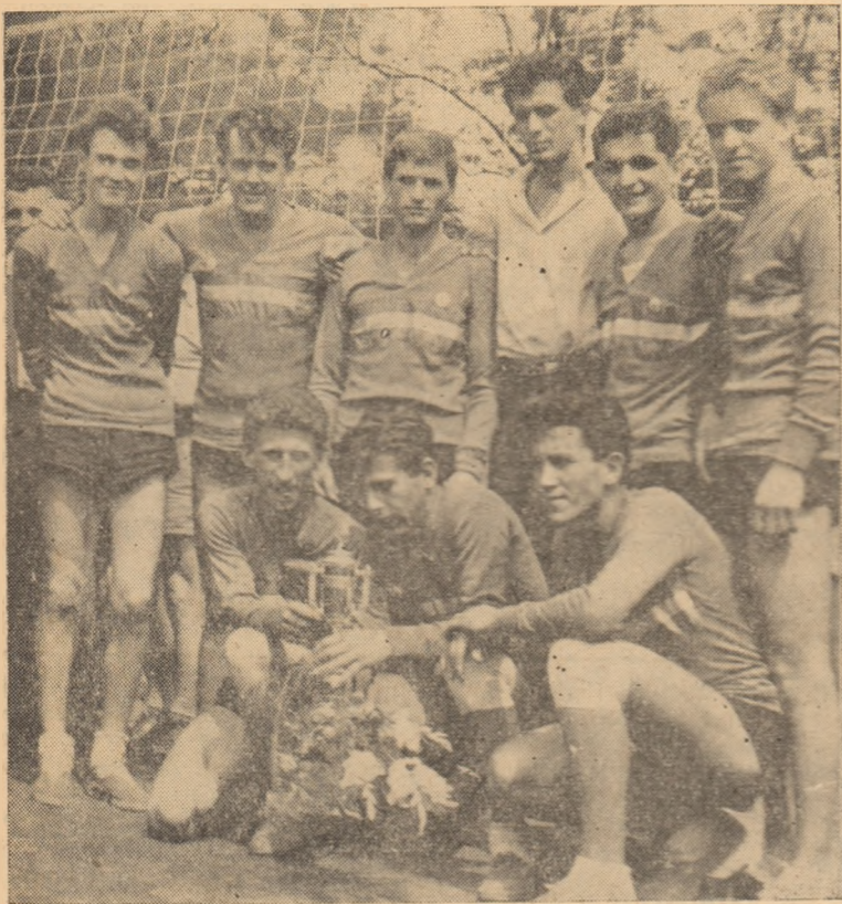
Echipa „Știința” Alba Iulia, campioana R.P.R. la volei-juniori.

Colectivele de muncă din întreprinderile raionului nostru au încheiat primul semestru al acestui an cu rezultate deosebite în creșterea producției și productivității muncii, în îmbunătățirea calității produselor. Mobilizații de organizație de partid, muncitorii, inginerii și tehnicienii au folosit într-o măsură mai mare rezervele interne ale întreprinderilor, au aplicat în producție procedee tehnologice noi.