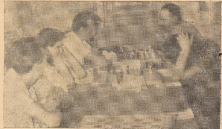
ÎN CLIȘEU: Aspect din timpul desfășurării campionatului de șah.