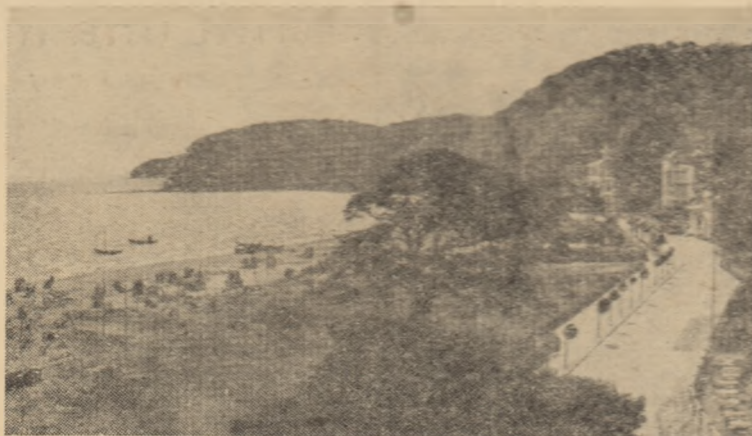
Casa de odihnă pe coasta Mării Baltice.

După terminarea noului sector, capacitatea de prelucrare a hîrtiei la rafinăria din Lützkendorf va crește de 3-4 ori. Aici se vor produce lubrifianti, carburanti, gaze lichide, acizi minerali, produse albe etc. La Lützkendorf se construiește, de asemenea, un nou cartier de locuit, o șosea și o gară de cale ferată.