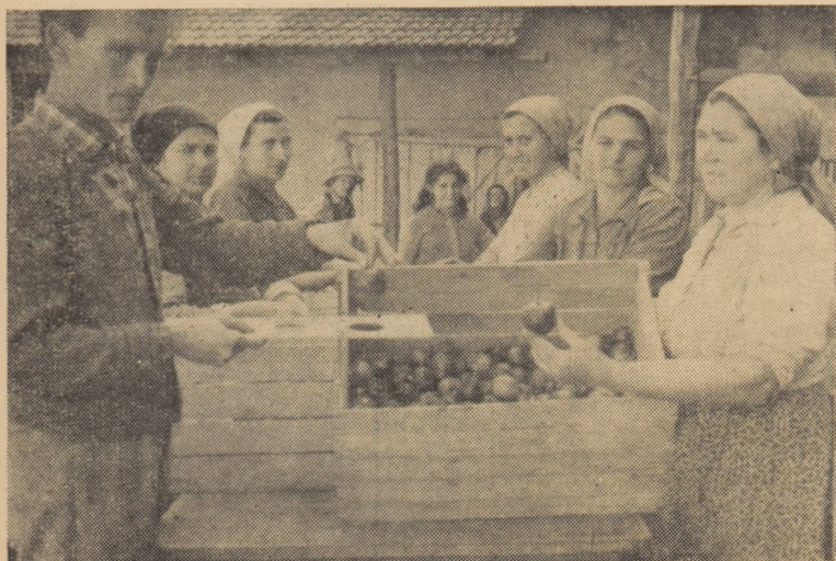
Sortatul merelor e o muncă de răspundere.

Pe baza analizei și a propunerilor făcute de deputați, sesiunea a adoptat o hotărîre în care se prevăd măsuri care să ducă la continua îmbunătățire a condițiilor materiale și a procesului de învățămînt în școli.