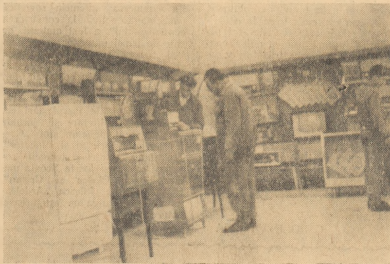
În clișeu: Noul magazin pentru desfacerea produselor electrice.

Încă din prima zi de deschidere, magazinul a cunoscut o mare afliuență de vizitatori și cumpărători. Valoarea produselor vîndute populației în cîteva zile se ridică la zeci de mii de lei.