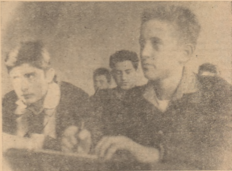
La școala profesională de meserii din oraș elevii au condiții din cele mai bune pentru învățatură.

★ „Întrebări și răspunsuri de preîntărirea economico-organizatorică a gospodăriei colective” este titlul cărții apărute tot în Editura politică. Broșura este scrisă cu scopul de a ajuta pe colectivități în cunoașterea cîtorva din problemele de bază ale întăririi economico-organizatorice a gospodăriei agricole colective.