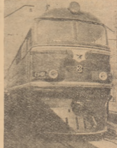
O nouă realizare în transportul feroviar sovietic: locomotiva cu turbină cu gaze fabricată la Uzina din Kolomma.

multe lucrări pregătitoare care trebuie făcute încă de pe acum, deoarece de reușita lor depinde în mare măsură producția de porumb boabe a anului viitor.