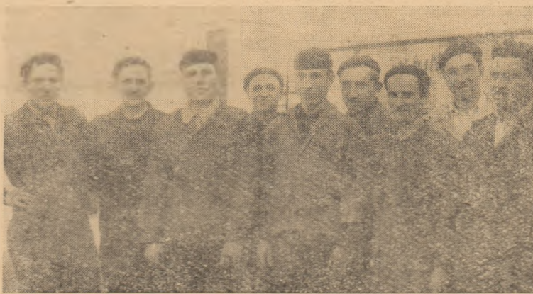
Colectivul de muncă de la secția turnătorie a Întreprinderii „Horia” din orașul nostru a raportat cu puțin timp înainte că și-a îndeplinit sarcinile anuale de plan. În clișeu: Colectivul secției turnătorie.

...în cadrul cooperativei meșteșugărești „Mureșul” a luat ființă secția de sobari-teracotieri.