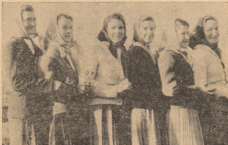
În clișeu: Citeva tinere collectiviste, membre ale brigăzii artistice de agitație a căminului cultural din Micești.

Și iată-i. Micii artiști amatori apar. Cîntă, recită, fără emoții. Corul interpretează cîntecele „Serile Moscovei”, „Steagul partidului” și „Pionieri, fruntea sus”. Unul cite un elev, elevii recită poeziile „Măreață-i vremea pe care o trăim”, „Cîntec de dragoste pentru Țara sovietică”, „Cîntec despre Lenin” și altele, apoi apar pe scenă micii dansatori și interpreții din piesa de teatru „Anotimpurile”, care, ca și toți ceilalți, sînt primiți cu aplauze.