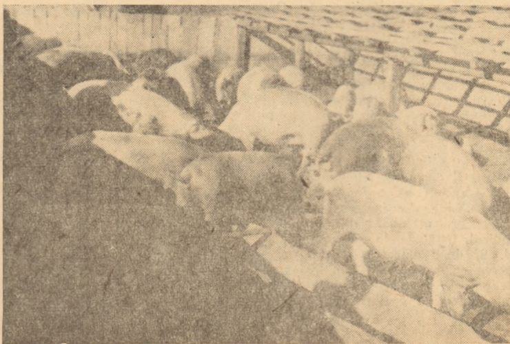
Bine îngrijiiți, porcii gospodăriei colective din Teiuș se dezvoltă repede.