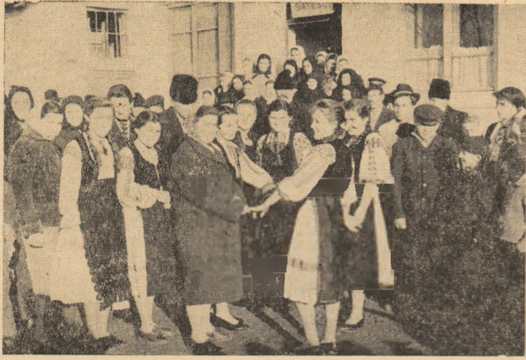
„Sărbătoarea recoltei”, organizată duminică trecută la Galda de Jos, a atras spre căminul cultural sute de colectivizatori.