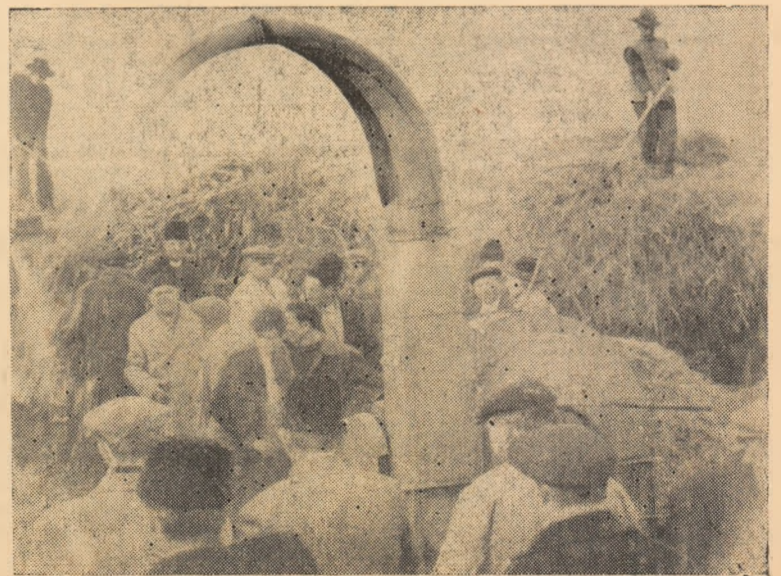
În clișeu: Aspect din timpul demonstrației practice la pregătirea furajelor.

În unele gospodării colective s-a realizat o bună muncă de defrișări, desfundări de terenuri arabile și de asanări, ceea ce a permis să se realizeze o suprafață de terenuri arabile în valoare de peste 100 ha.