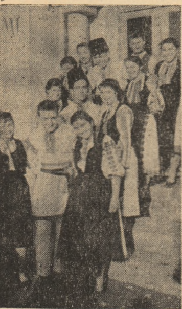
Tineri entuziaști, membrii brigăzii artistice de agitație a căminului cultural din Galda de Jos sînt gata să iese pe scenă.