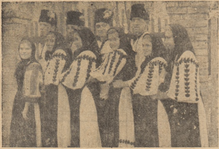
IN CLIȘEU: Brigada artistică de agitație a căminului cultural din Telna.