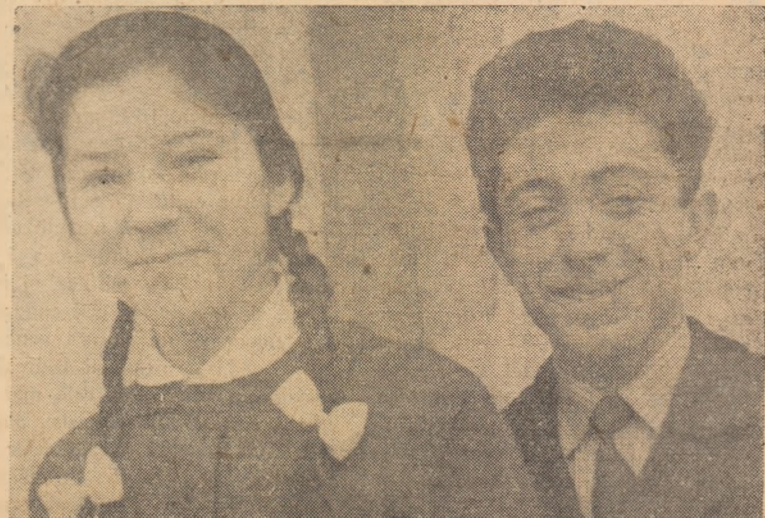
Și ei au împlinit 18 ani.