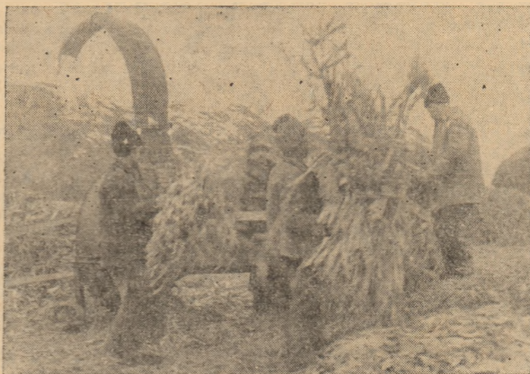
Colectiviștii din Alba Iulia acordă mare atenție pregătirii furajelor. ÎN CLIȘEU: Un aspect la tocarea tuteilor de porumb.