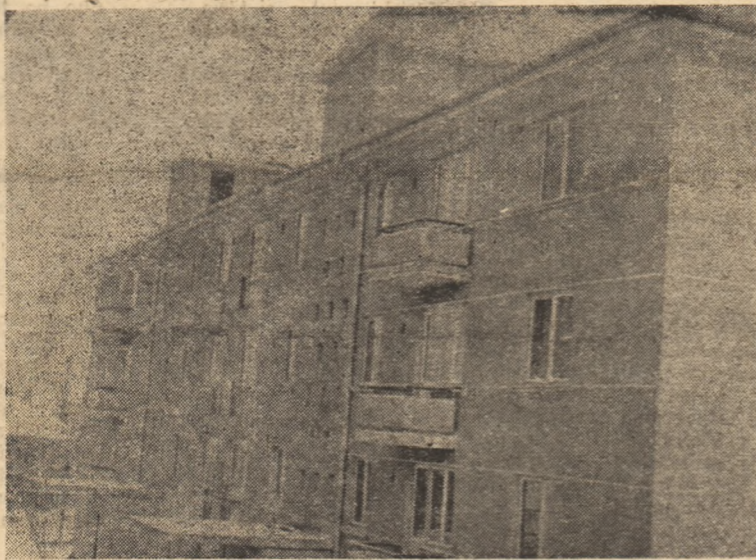
Peste puține zile blocul 2 din Alba Iulia își va primi locatarii. În prezent se lucrează la ultimile finisări.

★ Cortina s-a lăsat. S-a lăsat și înnumericul peste sală. În drum spre casă, însă, mă stăpînea același tablou plin de bucurie creat de tovarășii de lîngă mine, de colectivștii. Mi-am zis pentru mine: Cînd oare sub burghezie se putea crea un asemenea tablou? Niciodată! N.G.