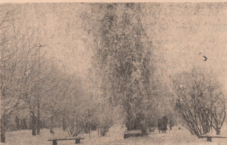
Iarna în parcul orașului.