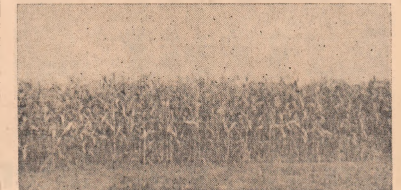
Așa arăta în vară lanul cu porumb HD 103 care a dat o producție de 6.287 kg porumb boabe la hectar.