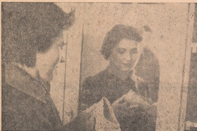
La secția de încălțăminte a cooperatizei „Progresul” din Alba Iulia. Confruntare în oglindă. Calitatea se îmbină cu frumosul.