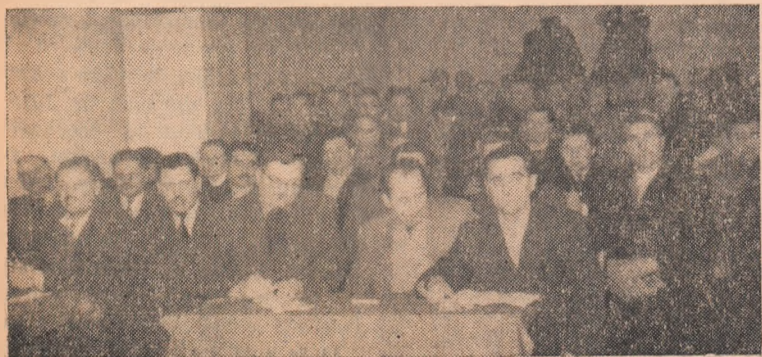
În clișeu: Aspect din timpul lucrărilor Consiliului agricol raional.