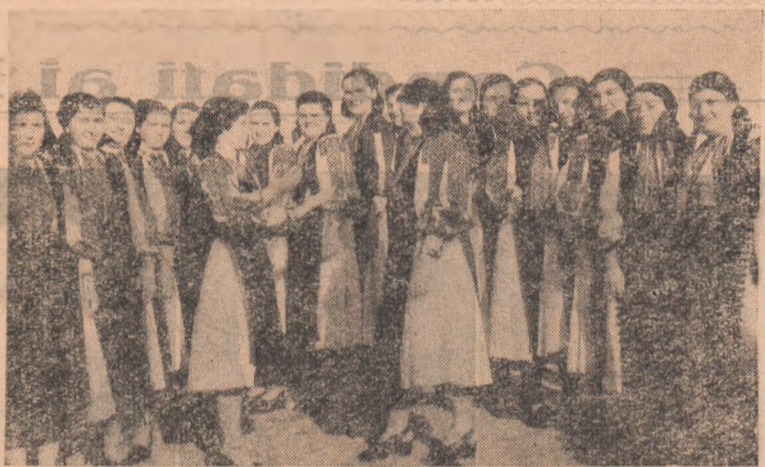
Le cunoașteți? Sînt colectivștele din brigada artistică de agitație a căminului cultural din Hăpria, harnice și pe ogor și-n activitatea culturală.