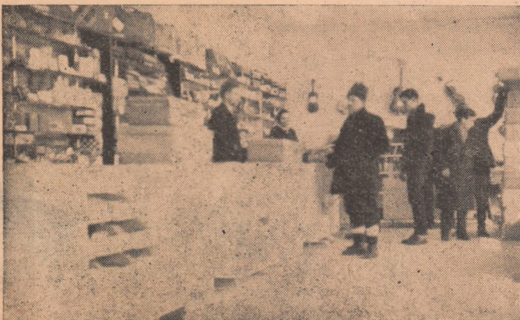
La parterul blocului din centrul orașului a fost deschis de curând magazinul de articole: Foto-Muzică-Sport.

Astăzi, oriunde îți îndrești privirea, ne întrec cuprinsul țării. Și se înfățișează chipul nou al țării cu o industrie în continuă dezvoltare, cu o agricultură socialistă mecanizată, cu o cultură înfloritoare — viața luminoasă pulsează cu vigoare pretutindeni. Miile de blocuri și case noi, școli și instituții culturale, cinematografe, unități sanitare, magazine moderne și alte unități de deservire publică sint tot altele dovezi care ne înfățișează viața nouă de azi făurită sub conducerea înțeleptului nostru partid.