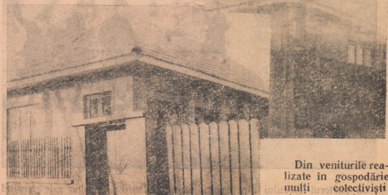
Din veniturile realizate în gospodărie mulți colectivștii și-au construit case noi.