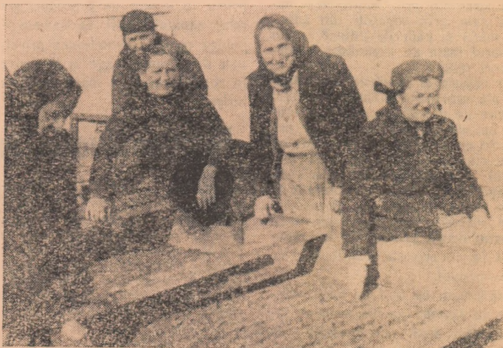
În clișeu: Un grup de colectiviste din brigada legumicolă a gospodăriei colective din Oarda de Jos, la controlul răsădului de varză timpurie.