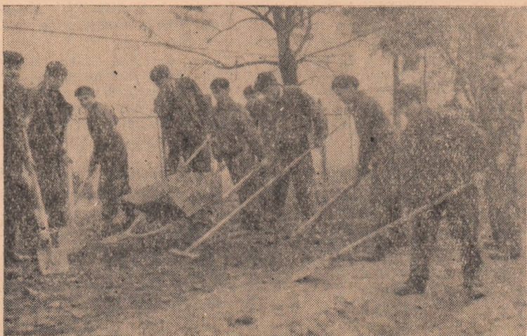
La chemarea primăverii, elevii Școlii profesionale de mecanici agricoli au pornit la înfrumusețarea im prejurimilor internatului.

sîm aproape la jumătatea lunii aprilie, sfatul popular nu a întreprins nimic concret pentru a mobiliza cetățenii la diferite acțiuni cu caracter gospodăresc. Și nu se poate spune că în comuna Ciugud, din acest punct de vedere n-ar mai fi nimic de făcut. Sînt în raza comunei drumuri de reparat, șanțuri de desfundat și alte lucrări ce trebuiau executate pînă acum. Dar aceasta nu s-a făcut. Se pune întrebarea: comuna Ciugud nu participă la întrecerea ce se desfășoară între comunele din raion? Dacă participă, atunci acest lucru trebuie dovedit prin fapte.