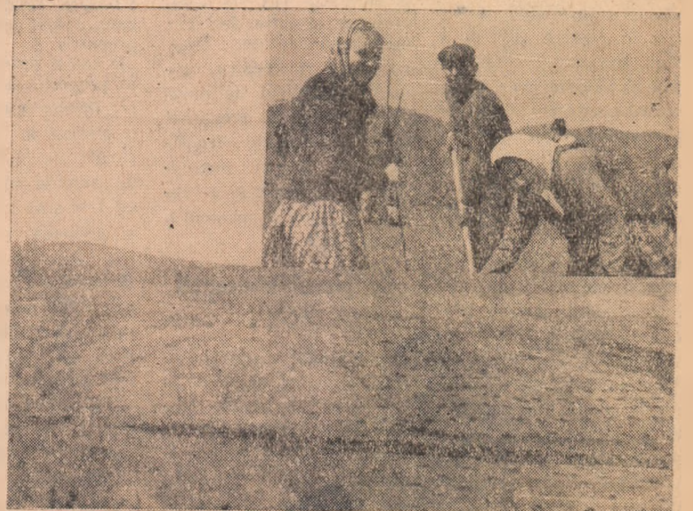
Bucuria tinerilor este pe deplin justificată. Peste puțini ani aici, la Bucurdea Vînoasă, unde se plantează cele aproape 100 ha cu meri, va rodi una dintre cele mai mari livezi din raion.

Grăbirea cu toate forțele a lucrărilor de plantare se impune atît pentru a realiza întreaga suprafață planificată, cît și pentru a efectua aceste plantări la nivelul cerut de regulile pomicele. Cum vremea e tîrzie s-ar putea produce o încălzire bruscă ceea ce ar dăuna pomilor. De aceea paralel cu celelalte lucrări din campania de primăvară ce se efectuează, conducerile gospodăriilor colective cu sprijinul organelor tehnice trebuie să ia toate măsurile pentru terminarea plantărilor. Acolo unde nu este asigurat materialul săditor și nici nu se găsește, trebuie studiate toate posibilitățile și în condițiile dictate de climă și sol să se planteze meri, dacă aceștia se pretează, deoarece merii pot fi