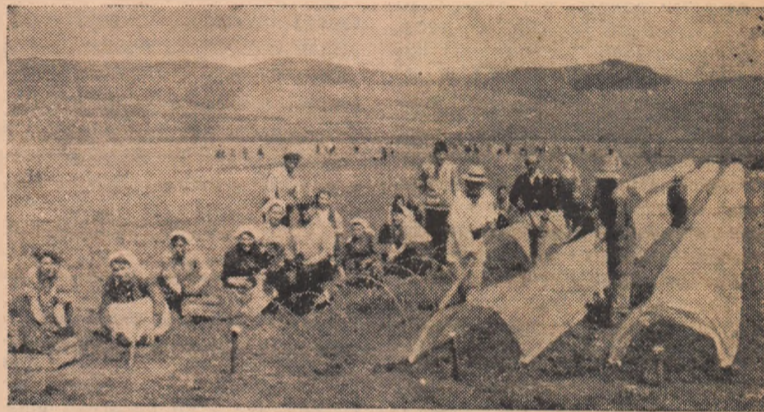
Bruma nu va mai constitui un pericol pentru grădina de legume a gospodăriei. Colectiviștii din Micești folosesc în acest scop polietilena.

La obținerea acestui frumos succes o contribuție deosebită și-au adus-o colectivele de muncă de la secțiile chimică și metalurgică, ca și colectivul de muncă din cadrul atelierelor de întreținere.