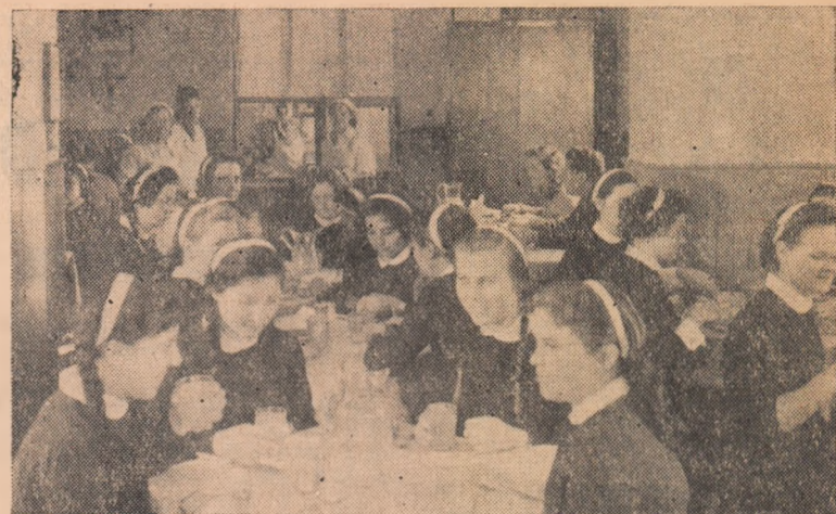
La Școala de cooperatie din Alba Iulia, elevilor le sînt create cele mai bune condiții de viață și învățatură. În clișeu: Elevii în sala de mese.