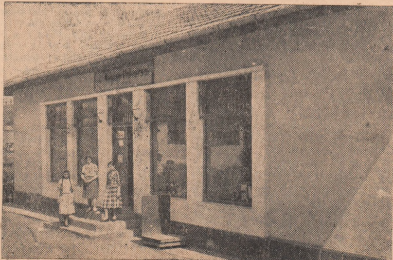
În magazinul universal nou construit, colectivștii din Berghin găsesc un bogat sortiment de mărfuri. În clișeu: Noul magazin.