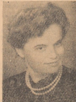
CUTCAN ETELEA muncitoare la fabrica „Ardeleana” Alba Iulia