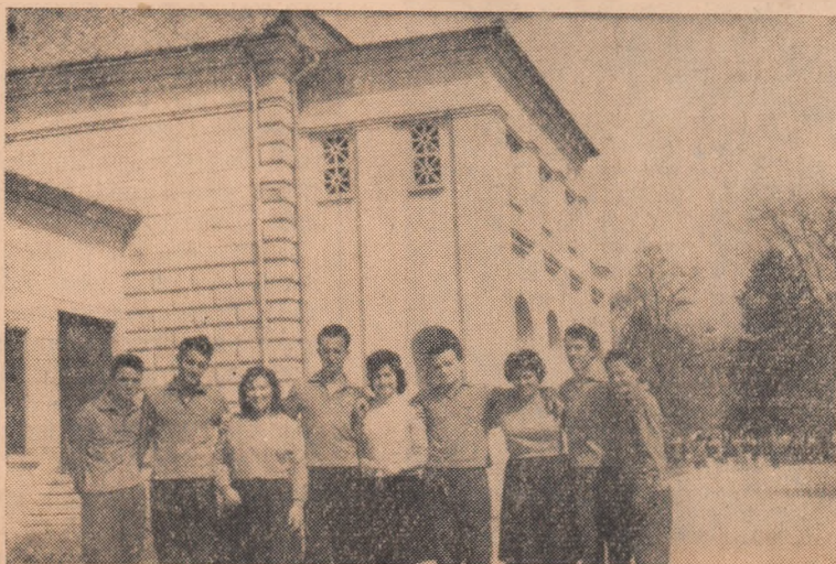
Entuziasm, bucurie, optimism. Iată ce caracterizează tineretul de azi.

În aceste zile de primăvară, întregul popor ia parte, alături de tînăra generație, la sărbătorirea Zilei tineretului din Republica Populară Romînă. Sărbătorită la 2 Mai, pentru a doua oră, Ziua tineretului din R.P.R. a intrat în tradițiile sărbătorilor noastre. Aducînd ecoul ne-