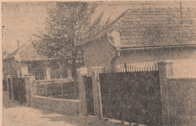
Comuna Oarda de Jos devine tot mai frumoasă. Case noi sînt zidite de către colectiviztii de aici pe toate ulițele. În clișeu: Două din cele aproape 60 case construite în ultimii ani.

Înfrațiți cu munca și cîntul oamenii de azi își trăiesc viața din plin. O viață adevărată luminată de învățătura partidului.