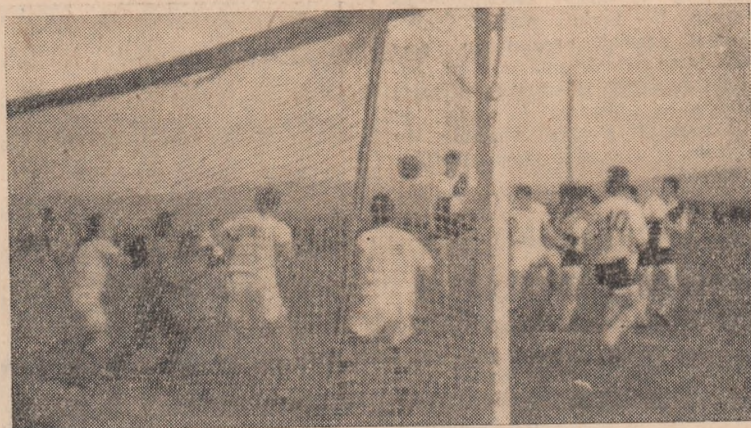
Mingea lovită cu capul de Popa se va opri în plasă. (Fază din meciul Dacia Alba — Victoria Călan (3-1).

La Universitatea din Kioto (Japonia) a fost realizată o mașină de scris care funcționează la dictare. Un dispozitiv de calcul-rezolvare analizează oscilațiile vocii și le transformă în impulsuri electrice, care apoi sînt introduse în dispozitivul de scris. Autorii noii mașini afirmă că ea poate să scrie după dictarea făcută în orice limbă.