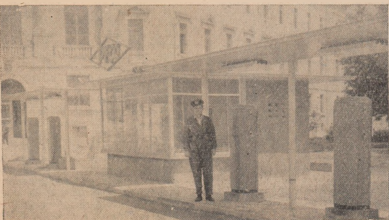
ÎN CLIȘEU: Noua stație de produse petroliere „PECO” dată recent în funcțiune la Alba Iulia.

★ Între 23-26 mai a.c. la cinematograful „Victoria” va rula filmul „Baronul de Munchausen” o producție a studiourilor cehoslovace.