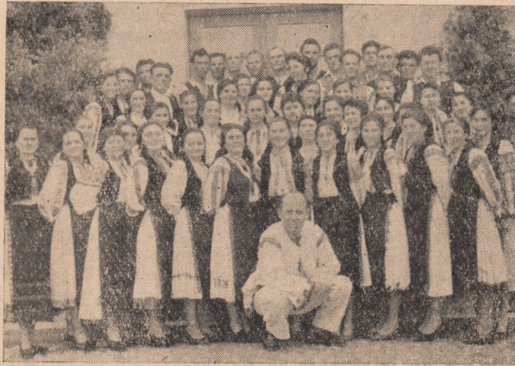
IN CLIȘEU: Corul căminului cultural din Stremț.