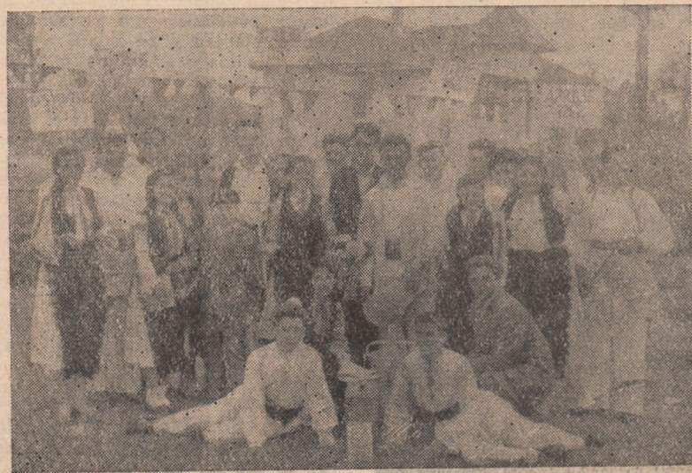
Emoțiile au trecut. Membrii brigăzii s-au prezentat bine pe scenă. IN CLIȘEU: Brigada artistică de agitație din Mihalt.