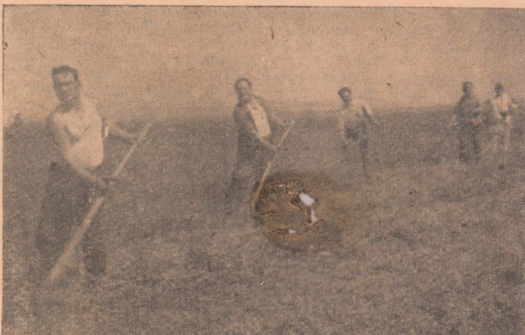
IN CLIȘEU: La G.A.C. Ciugud pe terenurile nemecanizabile munca pentru recoltarea furajelor este în toi.