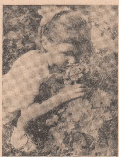
Două flori într-o grădină.

Organele și organizațiile de partid vor trebui să folosească cu mai multă pricepere mijloacele ce le stau la îndemînă pentru ca în perioada premergătoare deschiderii noului an în învățămîntul de partid munca de educare politică și ideologică a oamenilor muncii să se desfășoare la un nivel tot mai înalt, influențînd în mod pozitiv la îndeplinirea și depășirea sarcinilor economice, la educarea continuă a oamenilor muncii.