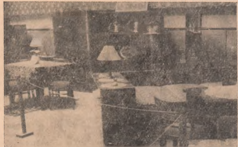
Doriți să vă mobilați locuința în mod plăcut și atractiv? Vizitați expoziția de mobilă organizată în sala clubului salariaților O. C. L. comerț-mixt din Alba Iulia. Alegeți și faceți comandă pentru mobilă preferată.