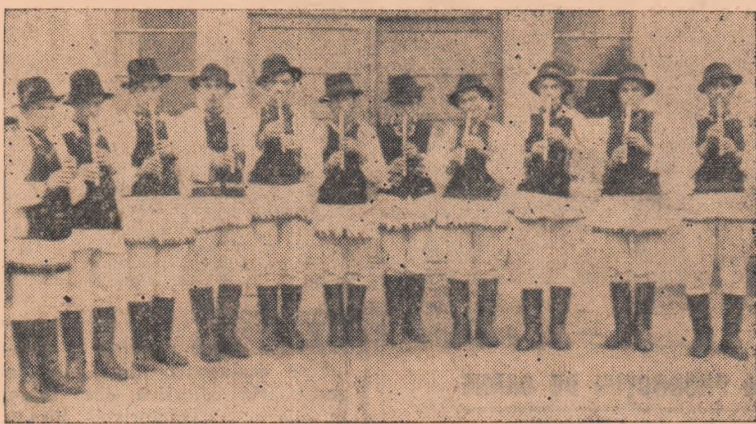
În clișeu: Echipa de fluierași a căminului cultural din Intregalde.