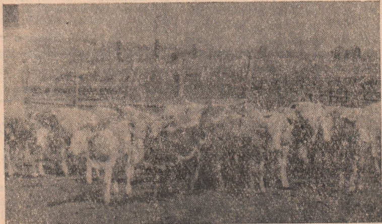
IN CLIȘEU: Vițeii gospodăriei colective din Teiuș.

Tărăgănarea cossitului duce la pierderea valorii nutritive a finului. De aceea în aceste zile comitetele executive ale săturilor populare, organizațiile de partid din comunele și satele rămase în urmă trebuie să ia toate măsurile ca recoltarea finurilor naturale să fie grabnic terminată.