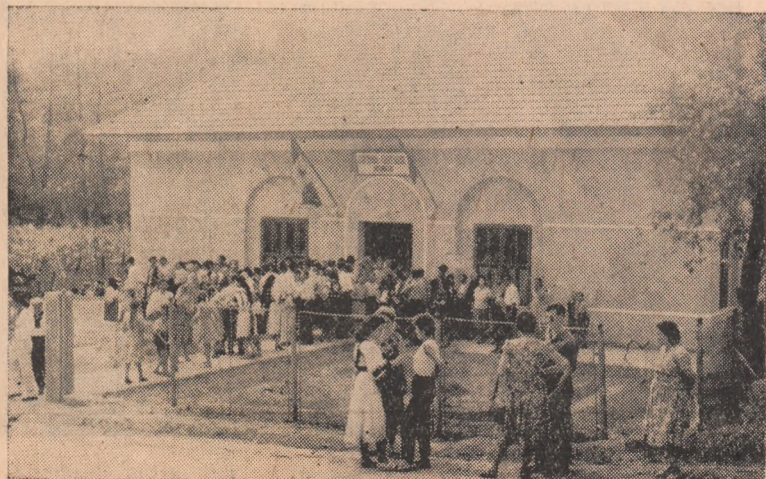
Cu un asemenea local de cămin cultural, tărani muncitori din Pătrînjeni sînt pe deplin îndreptățaji să se mîndrească.

...Examenele de corigență, absolviere, admitere și maturitate din sesiunea de toamnă — curs de zi, seara și fără frecvență de la Școala medie „Horia, Cloșca și Crișan” din Alba Iulia se țîn între 15 august — 30 septembrie 1963.