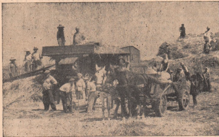
La G.A.C. din Ciugud treieriișul se apropie de sfîrșit. IN CLIȘEU : Aspect de la treieriiș.

Hotărîți ca prin străduința lor colectivă să fructifice cât mai bine experiența cîștigată, comunistii de la „Iprodcoop” depun toate eforturile pentru a-și îmbunătăți continuu stilul și metodele de muncă și în mod deosebit pe cele referitoare la organizarea muncii, repartizarea cât mai justă a sarcinilor și îndeplinirea acestora, conștienți fiind că în aceasta constă în mare măsură chezașia succeselor în rezolvarea problemelor ce le stau în față.