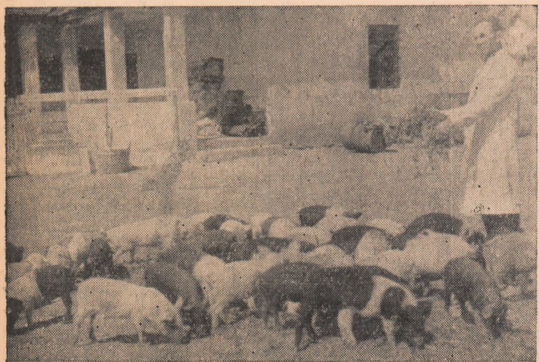
Creșterea porcilor aduce venituri mari colectivizărilor. În clișeu: Un nou lot de porci înțărcați la gospodăria colectivă din Galda de Jos.

sau „Înainte de termen” sînt numai câteva din materialele apărute în ziarul nostru local „Steaua roșie” și care se ocupă în mod special atît de analiza problemelor de bază ce stau în fața colectivelor noastre de muncă cit și de popularizarea metodelor și succesele dobîndite în muncă.