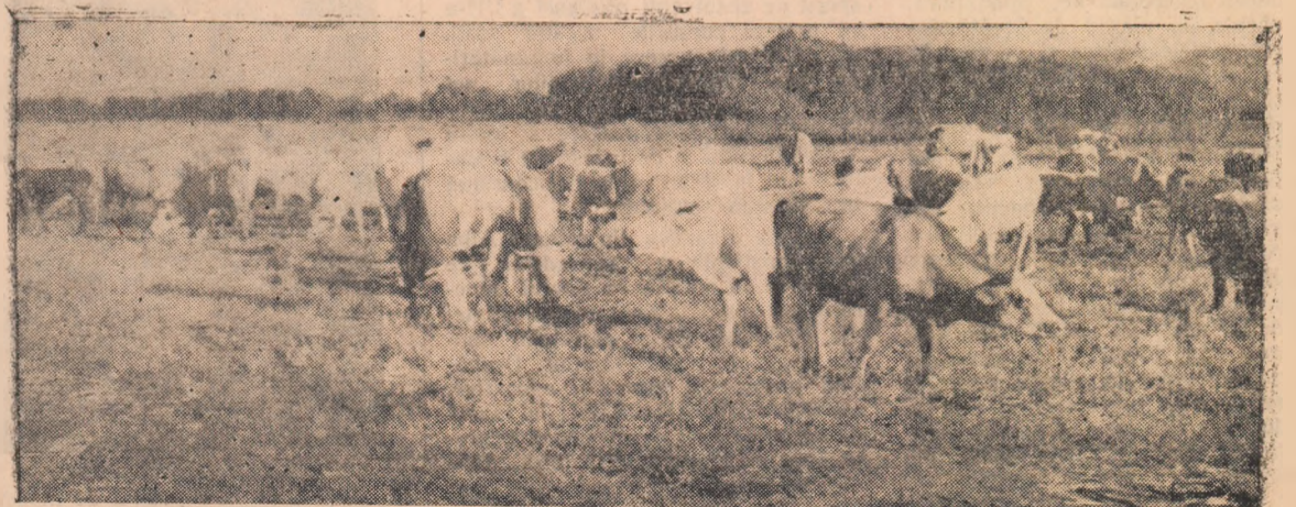
ÎN CLIȘEU: O parte din vacile gospodăriei colective din Cistei la pășune.