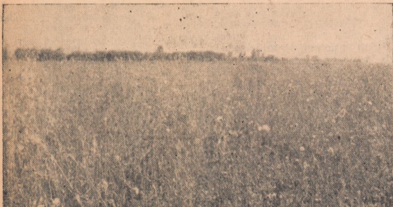
Nu este un cîmp cu flori. Este mohorul ce crește în voie pe o mare suprafață la G.A.C. Galtiu fără să fie însilozat.

cele, sînt destule resturi care pot fi însilozate dar aceasta se amîna în mod nejustificat de pe o zi pe alta. Trebuie arătat apoi că aici nici spațiul destinat însilozării nu este asigurat în întregime. Ținînd cont de faptul că gospodăria are un sector zootehnic dezvoltat — aproape 600 capete de animale — și trebuie să însilozeze aproape 4.000 tone furaje, consiliul de conducere al gospodăriei, cu sprijinul comitetului de partid trebuie să ia toate măsurile pentru grăbirea ritmului lucrărilor, astfel ca să se asigure viteza zilnică de 60 tone stabilită.