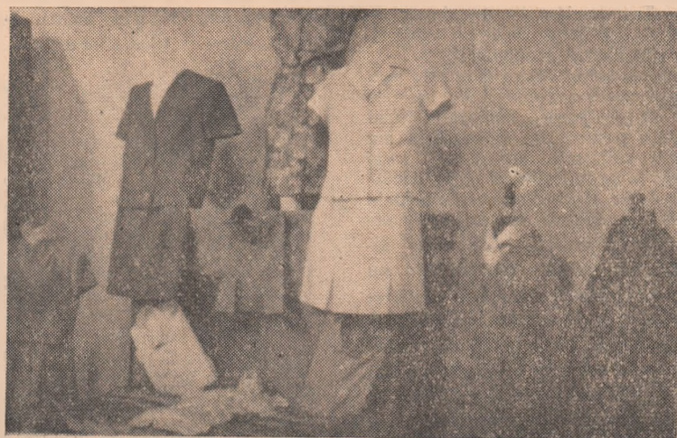
Aspect de la expoziția de modele a cooperativei „Mureșul”.