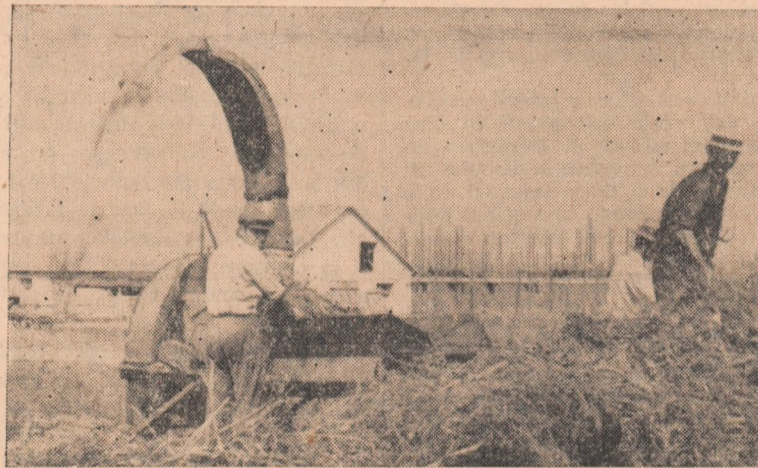
În cadrul G.A.C. Galda de Jos, brigada din Oiejdea, se însilozază de zor porumb siloz în amestec cu rogoz.

Se pune întrebarea cum socotește conducerea gospodăriei să-și asigure hrana animalelor? Răspunsul trebuie dat prin fapte.