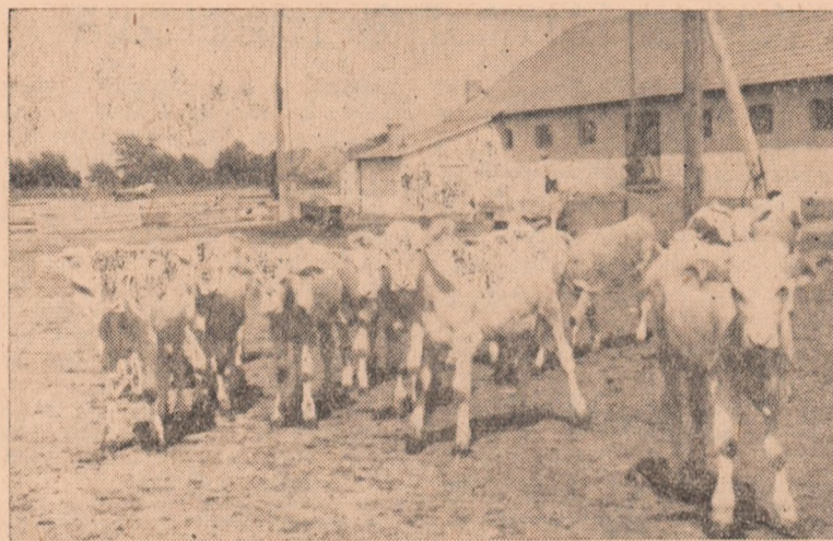
ÎN CLIȘEU: O parte din vițelii G. A. C. Galda de Jos.

La început de an școlar urăm tuturor elevilor, cadrelor didactice și părinților noi succese în educarea unui tineret bine pregătit și devotat partidului, cauzei fericirii poporului.