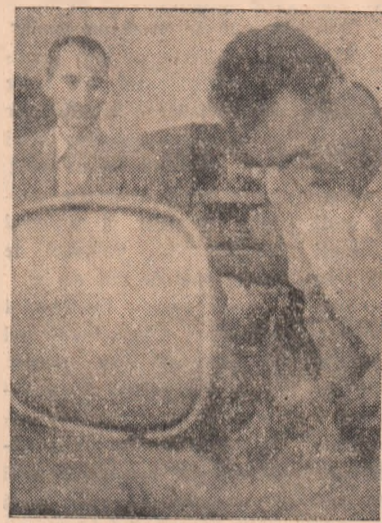
Cooperativa „Mureșul” a deschis de curînd o secție pentru repararea televizoarelor.