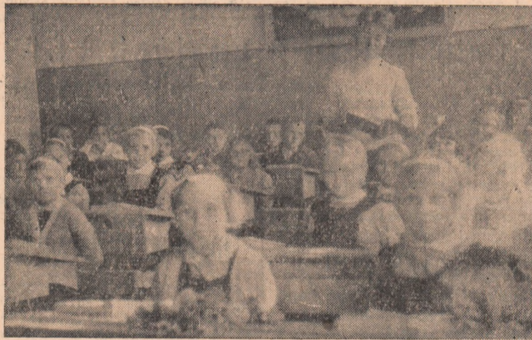
Prima lecție din noul an școlar.

Cu toți elevii prezenți apoi, munca a început. Și, cu toate că de la deschiderea noului an școlar n-au trecut decît cîteva zile, în activitatea Școlii de 8 ani din Benic au și fost deja înscrise primele succese: frecvența la clasă sută la sută, iar dorința elevilor de a cunoaște în continuă creștere.