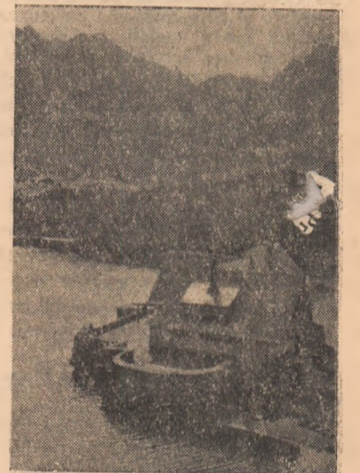
IN CLIȘEU: Unul din minunatele locuri pitorești din munții patriei — lacul și cabana Bilea.