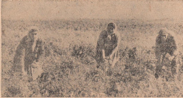
La G.A.C. Micești recoltatul gogoșarilor se apropie de sfîrșit.

Consiliul de conducere răspunde de desfășurarea muncii în gospodărie, dar nici comitetul executiv al sfatului popular nu poate fi străin de unele defecțiuni. Se cere deci mai mult interes.