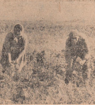
La G.A.C. Micești recoltatul gogoșarilor se apropie de sfîrșit.

Nu se întrebă oare conducerea gospodăriei, cînd va termina recoltatul porumbului, însilozatul cocenilor și celelalte lucrări din campanie, dacă se continuă să se tîrîgăneze efectuarea acestor lucrări? Pentru a curma asemenea rămînere în urmă, se impune ca atît conducerea gospodăriei și comitetul de partid cît și comitetul executiv al sfatului popular al comunei să ia măsuri hotărîte pentru mobilizarea tuturor colectivștilor la muncă.