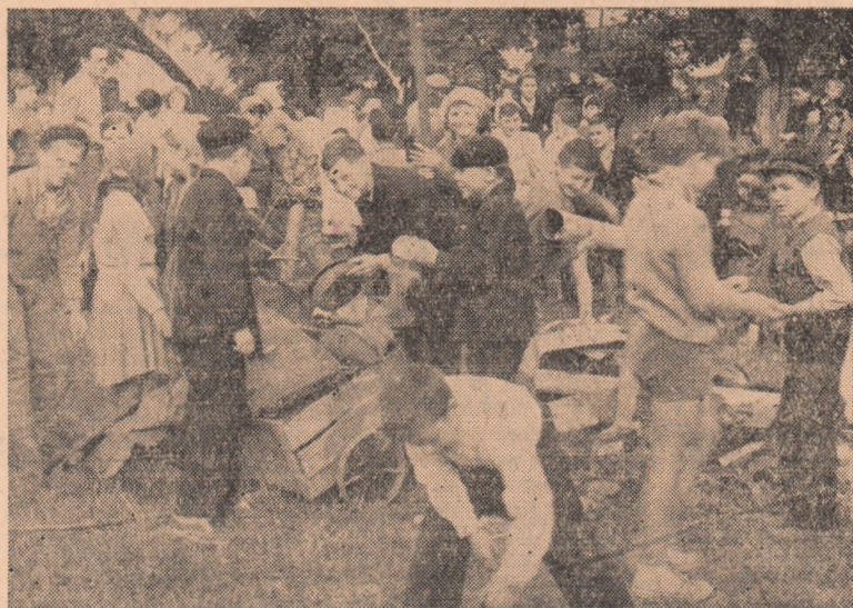
Fruntași la învățătură, elevii Școlii de 8 ani nr. 1 din Alba Iulia se situează printre cei harnici și în acțiunile patriotice. Iată-i la strînsul fierului vechi.