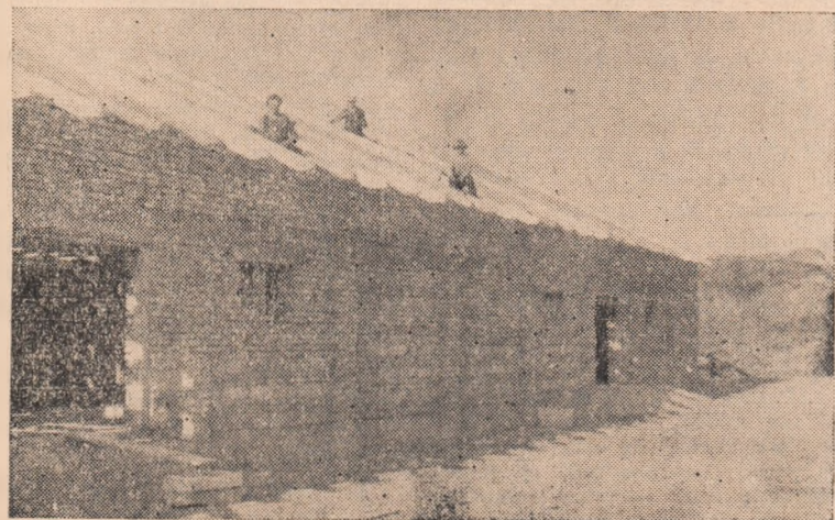
Membrii gospodăriei colective din Teiuș acordă toată atenția construcțiilor. Așa după cum se vede din clișeu, ei lucrează la acoperiș.

Membrii gospodăriei agricole colective din Teiuș acordă toată atenția asigurării condițiilor necesare iernării animalelor. Încă din primăvară aici s-au luat măsuri pentru terminarea construcțiilor atît zootehnice cît și a celorlalte construcții. Dat fiind dezvoltarea continuă a gospodăriei, conducerea a hotărît să mai construiască peste prevederile planului de producție, o maternitate de scroafe și o magazie. Atît la