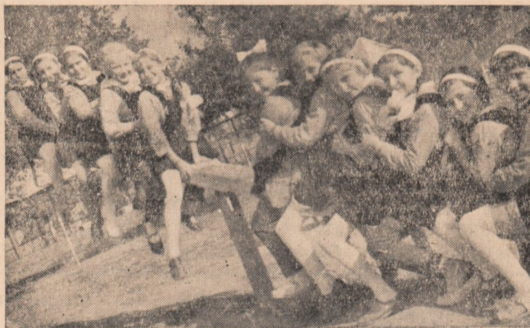
Și zilele însorite ale toamnei imbie copiii la joacă. ÎN CLIȘEU: Intr-una din pauze la Școala de 8 ani nr. 1 din Alba Iulia.

Zilele trecute s-a trecut la turnarea fundației noii școli. Colectiviștii din Șard au pornit cu entuziasm la executarea acestei lucrări și s-au angajat să muncească cu aceeași râvnă la toate lucrările de construcție a noului local de școală care va cuprinde 8 săli de clasă, un laborator, o sală pentru bibliotecă, o cabinetă profesorală, cabinet medical și sală pentru material didactic.