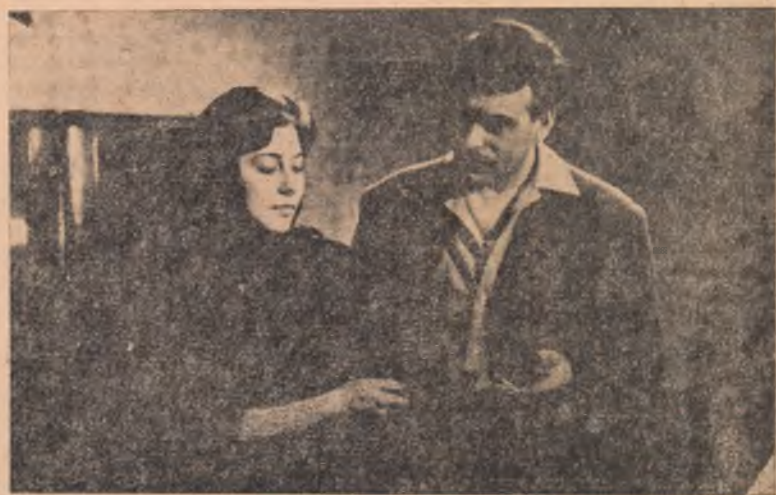
IN CLIȘEU: Scenă din filmul bulgar „Dintele de aur” ce rulează în aceste zile pe ecranul cinematografului „Victoria” din Alba Iulia.

Noului birou al organizației de bază i s-au făcut mai multe recomandări. În mod special să acorde mai multă atenție îmbunătățirii continue a muncii de partid. Propunerile făcute au fost cuprinse în hotărîrea luată de adunarea generală. Membrii biroului organizației de bază aleși li s-a recomandat să desfășoare o muncă colectivă, o activitate intensă pentru îmbunătățirea continuă a muncii politice în vederea îndeplinirii tuturor sarcinilor ce stau în fața organizației de bază, pentru mobilizarea comuniștilor la îndeplinirea tuturor sarcinilor politice și economice.