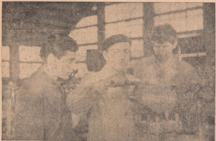
Ridicarea calificării tinerilor se bucură de întreaga atenție la secția Ateliere centrale din Alba Iulia.

...Duminică, 10 noiembrie, pe stadionul „Refractara” se va desfășura meciul de fotbal dintre echipele C.F.R. Simeria — Refractara Alba Iulia din cadrul campionatului regional de fotbal.