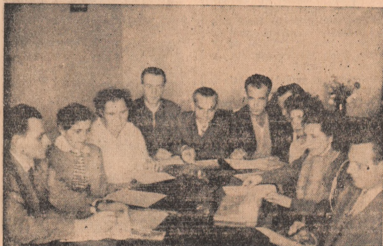
Biroul organizației de bază de la fabrica „Ardeleana” la prima ședință.

În cadrul hotărârii adoptate s-au stabilit măsuri pentru lichidarea acestor lipsuri, pentru îmbunătățirea continuă a muncii politice de masă.