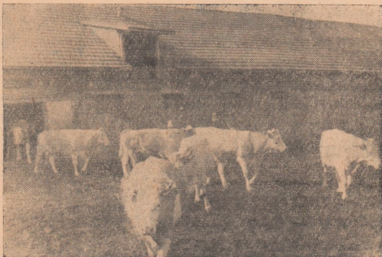
Gospodăriile colective dezvoltă tot mai mult sectoarele zootehnice.

Îndeplinirea hotărîrilor luate de către adunarea generală pe baza analizei făcute, va duce la întărirea gospodăriei colective și la creșterea bunăstării colectivităților.