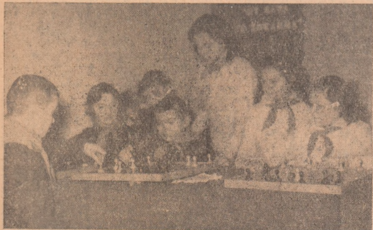
Varietatea activităților organizate la Casa pionierilor din orașul nostru atrage zilnic aici zeci de pionieri. ÎN CLISEU: După o partidă de șah și una de dame e la fel de interesantă pentru amatorii acestui joc.

...În ziua de 7 februarie a.c., pe scena Casei raionale de cultură, Teatrul de stat Turda va prezenta spectacolul „Băiat bun, dar cu lipsuri” de Nicuță Tănase.