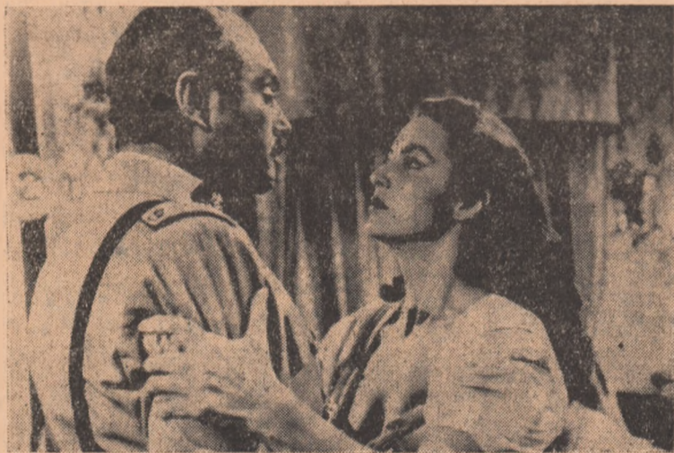
IN CLIȘEU: Scenă din filmul mexican „Escondida”.

Plină de remușcare, Gabriela imploră moartea. Iubirea este însă mai puternică decît ura și Felipe o iartă. Ea îl va urma în acțiunile lui pe luptătorul ce va deveni unul din comandanții răsculaților. Impușcată întîmplător chiar de răsculați, Gabriela rămîne o amintire dragă lui Felipe.