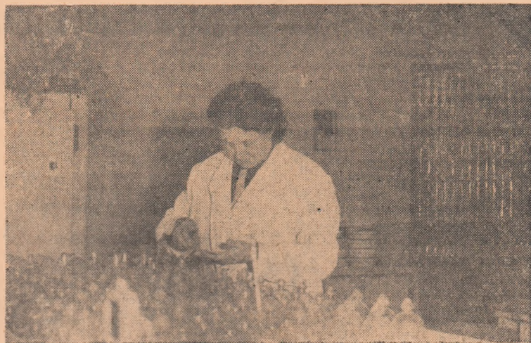
La laboratorul regional pentru controlul semințelor se verifică puterea de germinație.