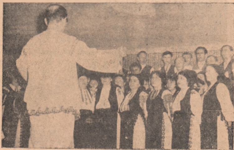
Aspect de la faza intercomunală a celui de-al VII-lea concurs, desfășurată duminică trecută la Stremț. Pe scenă, corul căminului cultural din Stremț.

Faza intercomunală a concursului, desfășurată duminică trecută în cele două centre, s-a bucurat de o bună reușită. Reușita putea fi însă deplină dacă n-ar fi intervenit unele deficiențe privind transportul formațiilor artistice la centrele de concurs. Urmare unor asemenea lipsuri, formațiile artistice ale clubului C.F.R. Teiuș și cele ale căminului cultural din Pețelca n-au participat la faza intercomunală de la Stremț și acest lucru trebuie să dea de gîndit conducătorilor celor două unități culturale.