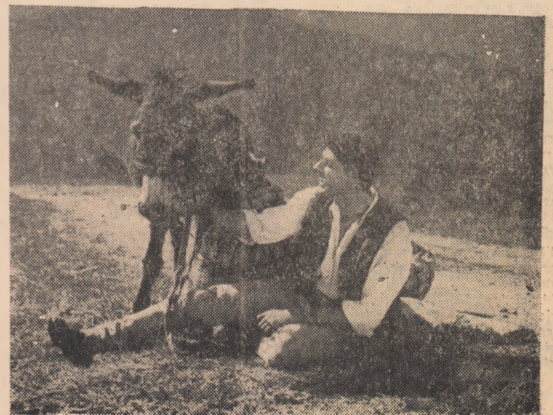
IN CLIȘEU: O scenă din film.

Trebuie lichidată practica Sfatului popular al comunei Oarda de Jos, ca de altfel și a altor sfaturi populare comunale, de a se ocupa