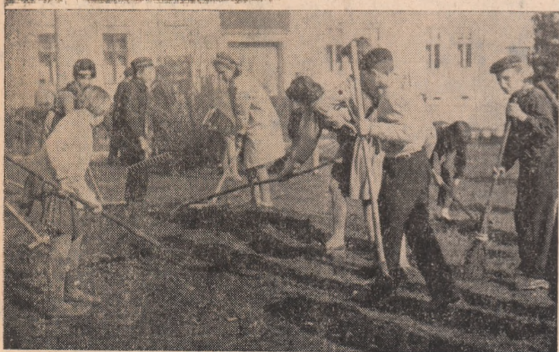
Sirguincioși la învățură, elevii Școlii de 8 ani nr. 1 sînt la fel de harnici și în acțiunile patriotice de înfrumusețarea orașului.