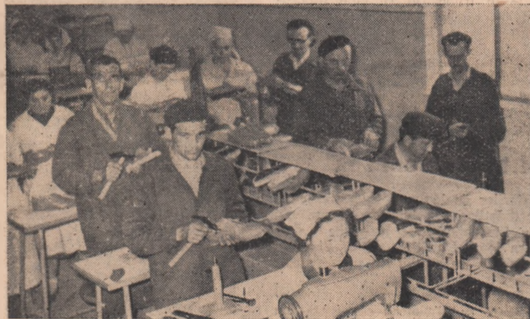
Aspect din noua secție pentru încălțăminte „Superflex” de la fabrica „Ardeleana” Alba Iulia, intrată de curînd în funcție.