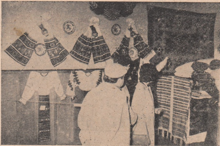
ÎN CLISEU: Parte din obiectele de artă populară din expoziție.

Ca și în centrele de comună expoziția organizată la Casa raională de cultură s-a bucurat de un real succes și în orașul nostru fiind vizitată încă în primele 5 zile de peste 900 de oameni ai muncii.