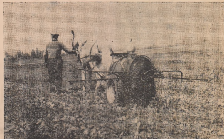
La G.A.C. Galtiu se lucrează din plin la întreținerea culturilor. ÎN CLIȘEU: Aspect la combaterea bu ruienilor cu „Diclodon sodiu”.

și efectuarea lucrărilor de plivit și întreținut legumele cultivate în cadrul gospodăriei colective.