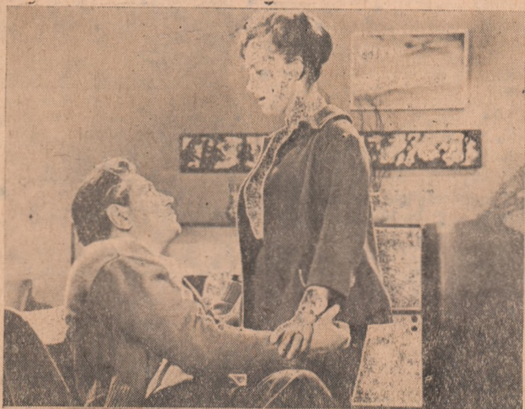
La cinematograful „Victoria” din orașul nostru rulează de la data de 11 iunie pînă la data de 14 iunie a.c. filmul „Totul rămîne oamenilor” o producție a studiourilor sovietice. IN CLIȘEU: Scenă din film.