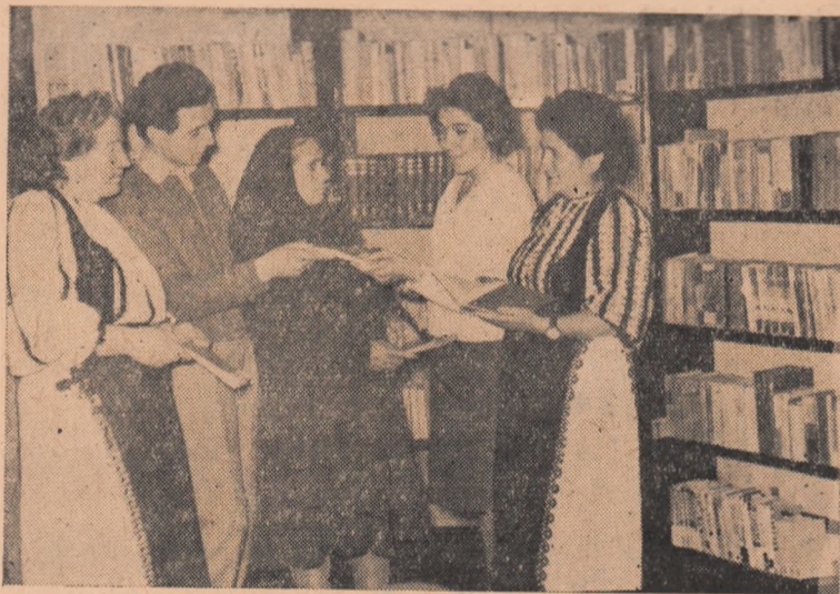
La biblioteca comunală din Vințul de Jos au sosit noi cititori.

Și într-adevăr, fulger neîntrerupt va rămîne peste veacuri opera acestui strălucit fiu al poporului nostru.