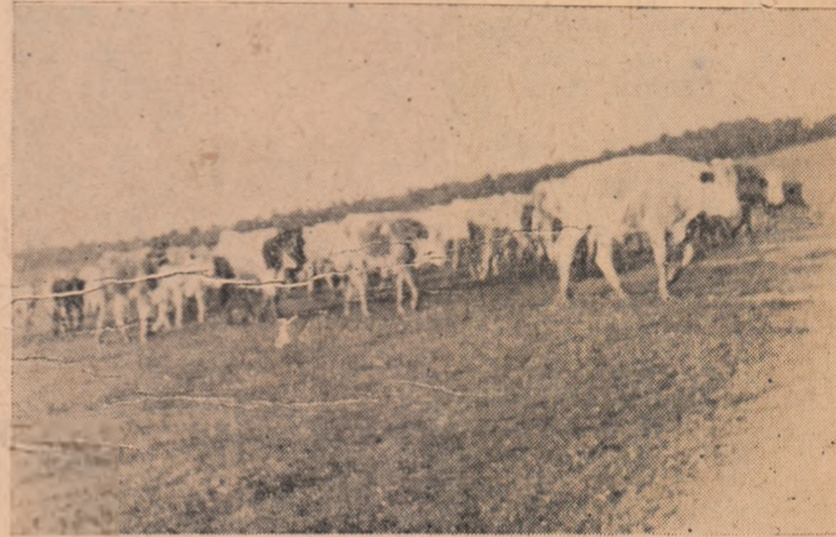
Gospodăria colectivă din Straja, acordă o atenție deosebită dezvoltării creșterii animalelor. ÎN CLIȘEU: În drum spre pășune.

Asigurarea recoltării și însilozării la timp a furajelor este o importantă sarcină ce trebuie privită cu toată răspunderea. De aceea să nu precupețim nici un efort pentru a asigura o bogată bază furajeră animalelor din gospodăriile colective.