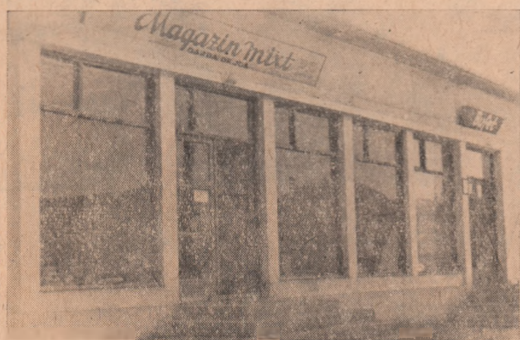
Printre numeroasele magazine ale cooperăției de consum din raion construite în ultimii ani se află și cel de la Oarda de Jos.

Lucrările de prășit și asigurarea unei densități corespunzătoare la hectar sînt hotărâtoare pentru sporirea recoltei de porumb. De aceea organizațiile de partid, consiliile de conducere, fiecare om al muncii care lucrează în agricultură trebuie să muncească cu toate forțele pentru îndeplinirea la timp a acestor importante sarcini.