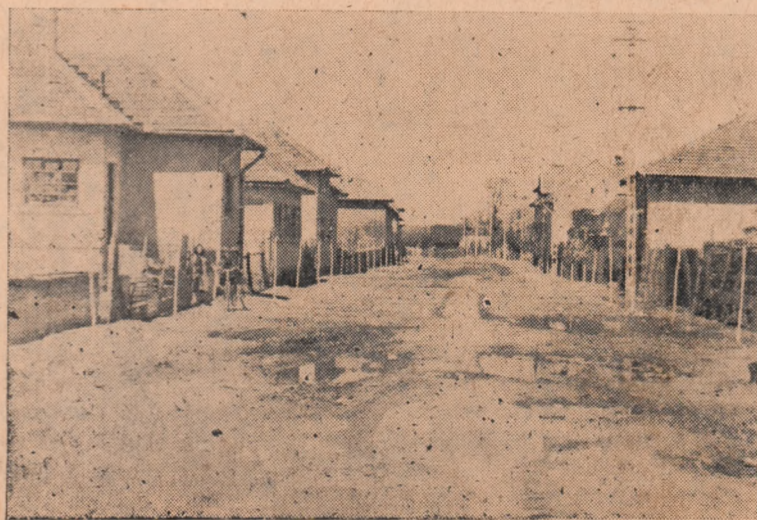
În clișeu de față se poate vedea cum arată strada Traian pe unele porțiuni.

Cetățenii de pe strada Traian au întreprins unele acțiuni laudabile. Ei au văruit arborii ornamentali și au amenajat ronduri de flori în jurul lor, alții au transportat în fața locuinței lor pietriș. S-a format un comitet de inițiativă pentru executarea trotuarelor din dale de beton. Trebuie spus însă că inițiativa și acțiunile lor nu au fost sprijinite de Sfatul popular al orașului. Este necesar ca organul local al puterii de stat să răspundă prin fapte cererii pe deplin justificate a cetățenilor de pe strada Traian.