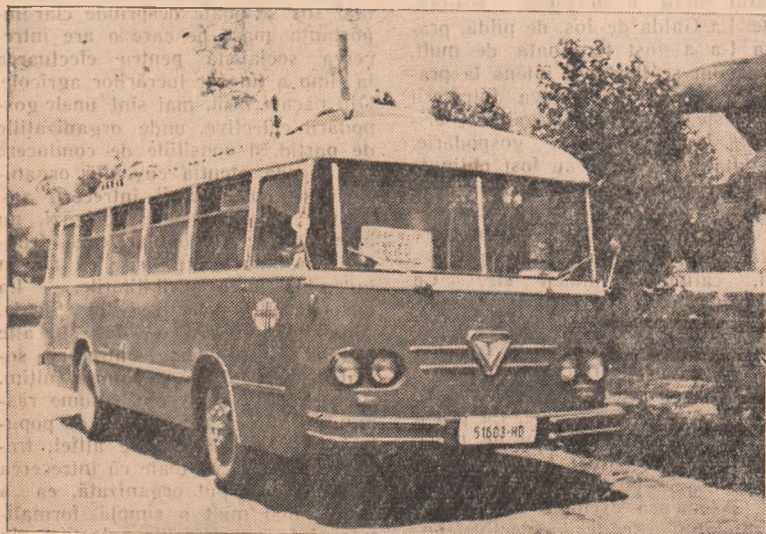
Încă cu ani în urmă, pentru colectivizatorii din Cricău, problema legăturii cu orașul a fost pe deplin rezolvată prin înființarea unui traseu auto. ÎN CLISEU: Autobuzul I.R.T.A. gata de plecare în cursa Cricău—Alba Iulia.