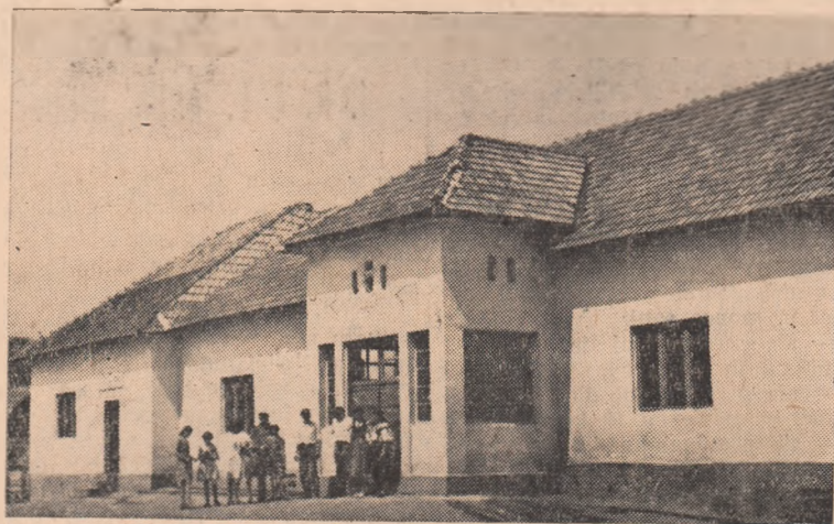
ÎN CLISEU: Clădirea căminului cultural din Cricău unde colectivizatorii de aici își petrec plăcut și instructiv timpul liber.

Conduși de partid, oamenii Cricăului cresc. Sint în plin urcuș. Și marșul spre lumină li tot mai avîntat.